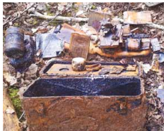
Atverot Remtes pagasta mežā atrasto metāla kasti, redzams, ka iekšā ir privātas mantas: nauda, fotogrāfijas, higiēnas priekšmeti, arī pavēles un biogrāfisks dokuments.

• Ar likumu ir aizliegti nesankcionēti izrakumi pilskalnos, seno apbedījumu vietās, aizliegts piesavināties mantas, kas tapušas līdz 18. gadsimtam. Atrakt un paturēt jaunāku laiku priekšmetus, ja meklēšana ir saskaņota ar zemes īpašnieku, nav sodāma rīcība.