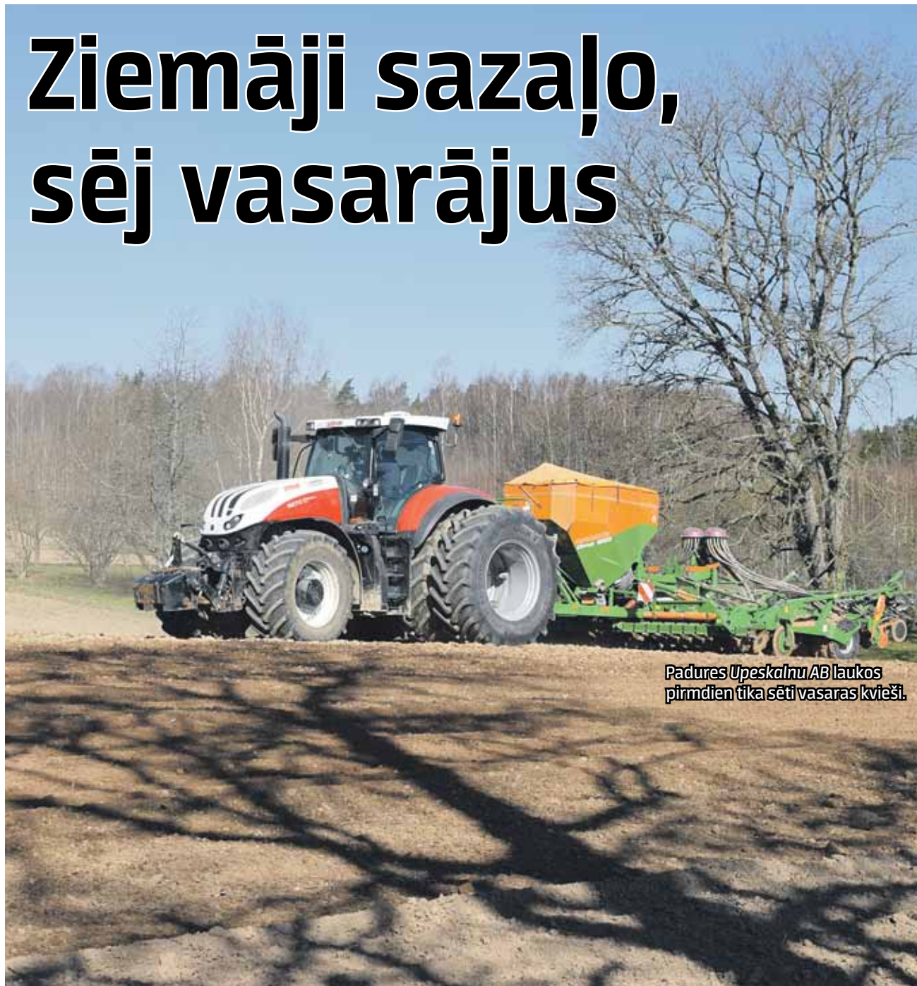
Padures Upeskalnu AB laukos pirmdien tika sēti vasaras kvieši.