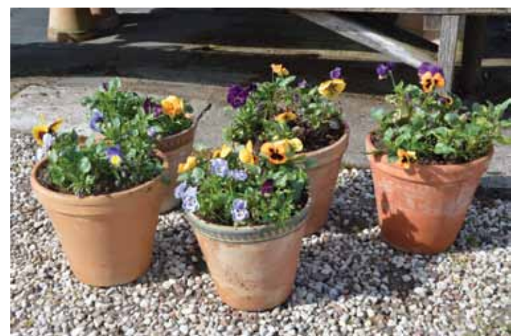
Priciġo atraitnīšu laiks – tām podos un kastēs patiek tieši vēsajā pavasarī.