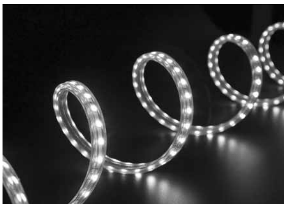
No LED spuldzes gaismu izstaro mazas diodes. Tā ir krietni izturīgāka un kalpo ilgāk nekā jebkurš cits veids.

Labs apgaismojums palīdz atšķirt priekšmetus, rada uzmodrinošu noskaņu, ceļ emocionālo tonusu, paaugstina darba ražīgumu un kvalitāti. Nepietiekams apgaismojums dara pretējo: piepūlē redzi, nomāc organisma fizioloģiskās