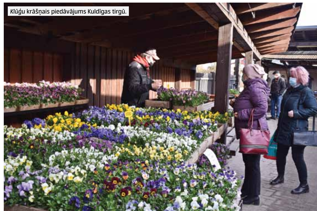
Klūģu krāšņais piedāvājums Kuldīgas tirgū.

Kādas ir pieprasītākās augļkoku un ogulāju šķirnes? Kas jāzina par tomātu audzēšanu? Kādus krāšņumaugus izvēlēties visai vasarai? Atbildes uz šiem un citiem jautājumiem sniedz mūspusē atzīti dārzkopji.