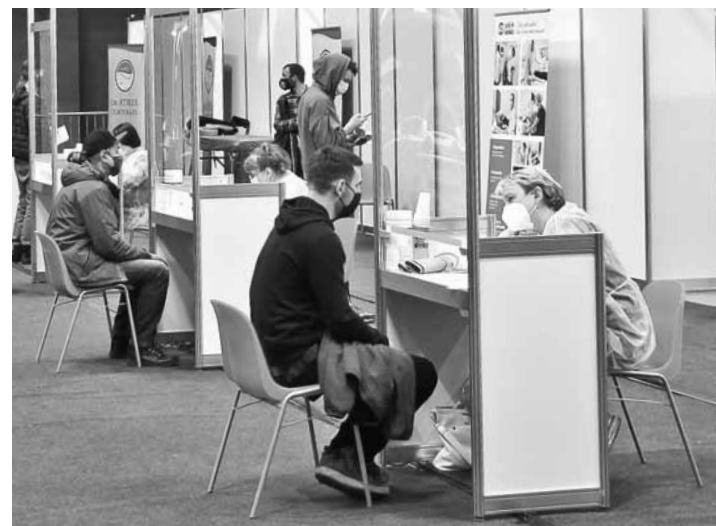
Liepājas olimpiskā centra vakcinācijas zāle pusdienlaikā. Medicīnas darbinieki konsultē tos, kuri gaidījuši dzīvajā rindā.

Vakcinācijas centra darbiniece sacīja, ka ar piešķirto devu