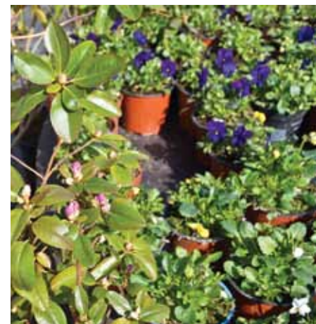
Augu, šķirņu un krāsu kombināciju izvēlas katrs pats.