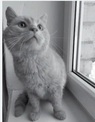
Apes ielā, pie kaķu mājiņām atrasts ruds, kastrēts runcis. Iespējams, saimnieks meklē savu mīlu.