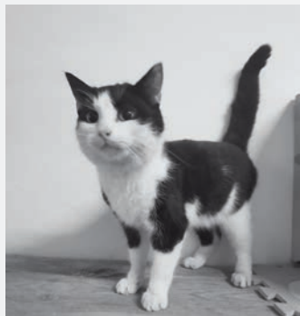
Alūksnē, Merķeļa ielā 17 pieklidīs milīgs melnbalts runčuks.