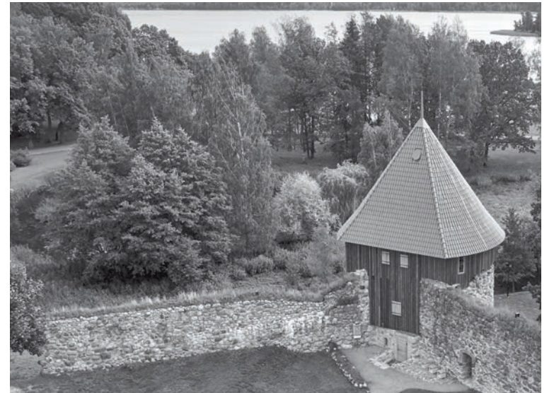
Alūksnes viduslaiku pils Dienvidu tornis pēc pārbūves

- Torņa ekspozīcijas pamata komponente ir stāsts, kura iedarbība sakņojas mūzikā, dziedājumā. Projekts paredz radīt stāstu par Marienburgas pils brāļiem - torņiem, kurā tie pārtop reālās, cauri gadsimtiem dzīvojušas un dzīvojošās būtnēs, par tēliem, kuros spējam tvert cilvēces universālās kaislības,