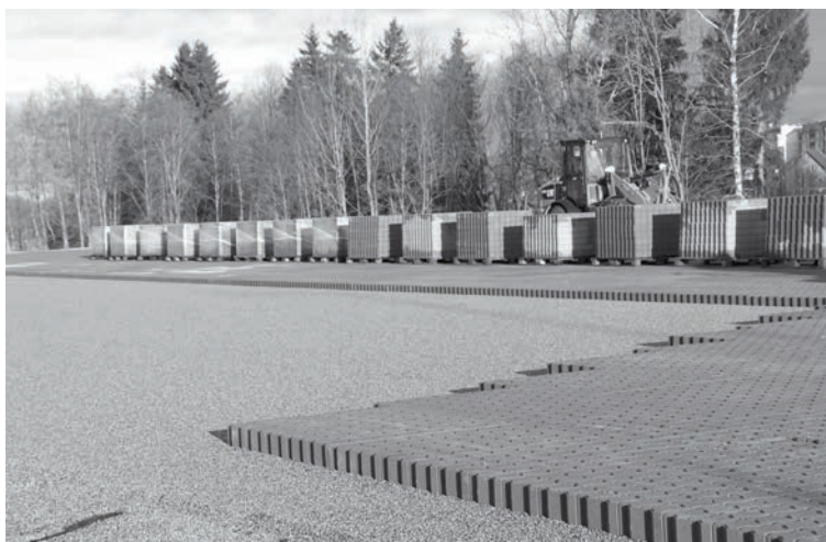
Brūģēšanas darbi objektā šoruden

Lai veicinātu novada ekonomisko aktivitāti, šis projekts paredz turpināt sakārtot vienu no lielākajām rūpnieciskās apbūves zonām, kas atrodas degradētā ražošanas teritorijā, izveidojot tur industriālo laukumu ar nepieciešamiem inženierkomunikāciju pieslēgumiem, tādējādi padarot to pievilcīgu uzņēmējdarbības attīstībai un atbilstošu uzņēmēju vajadzībām. Projekta galvenās aktivitātes ir bruģēta laukuma izveide, ūdenssaimniecības infrastruktūras pieslēgumu, centralizētās siltumapgādes sistēmas atzara un elektroenerģijas pieslēguma izbūve industriālajai teritorijai.