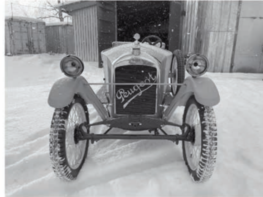
PEUGEOT TYPE 172 Automašīna atradās Apē līdz 1977. gadam