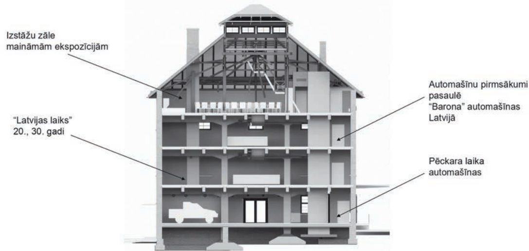
2. stāva ekspozīcijas piemēri