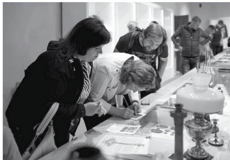
Muzeju nakts norises Alūksnes muzejā 2019. gadā

No kultūras iestādēm muzeji bija vieni no pēdējiem, kas tika slēgti apmeklētājiem. Tādēļ vēl decembrī Alūksnes muzejā klātienē varēja baudīt ziemas un svētku noskaņus Latvijas Floristu apvienības veidotajā