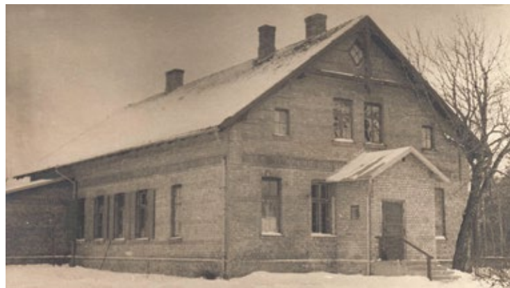
Pētera skola; 20. gadsimta 20. gadi.