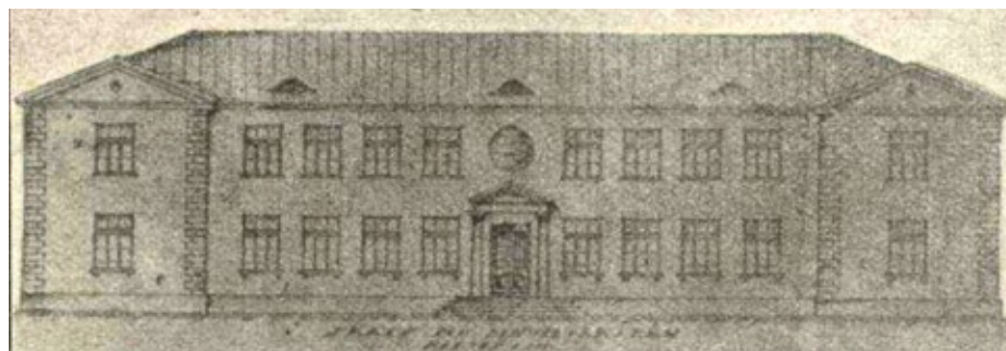
Babītes pamatskolas 1924. gada projekta skice.