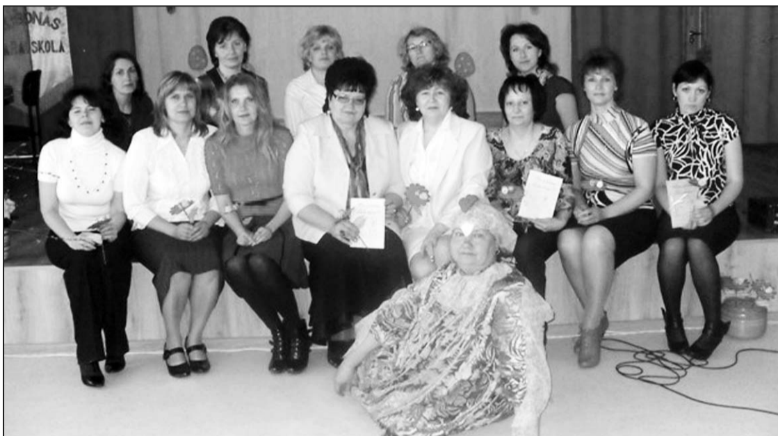
Pirmsskolas izglītības pedagogu kopbilde Rušonas pamatskolā ar kolēģēm un Lieldienu cāli.