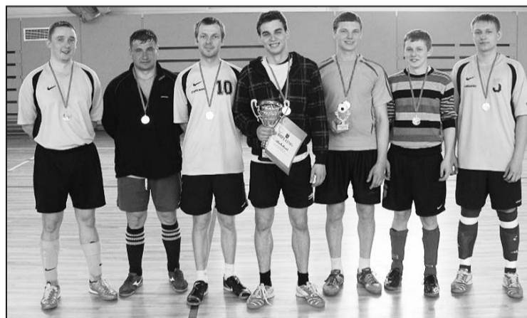
Novada telpu futbola turnīra uzvarētāji 2011. gadā – Stabulnieku komanda.

Spēle par sudraba medaļām emocionālā spēlē Rušonas ko-