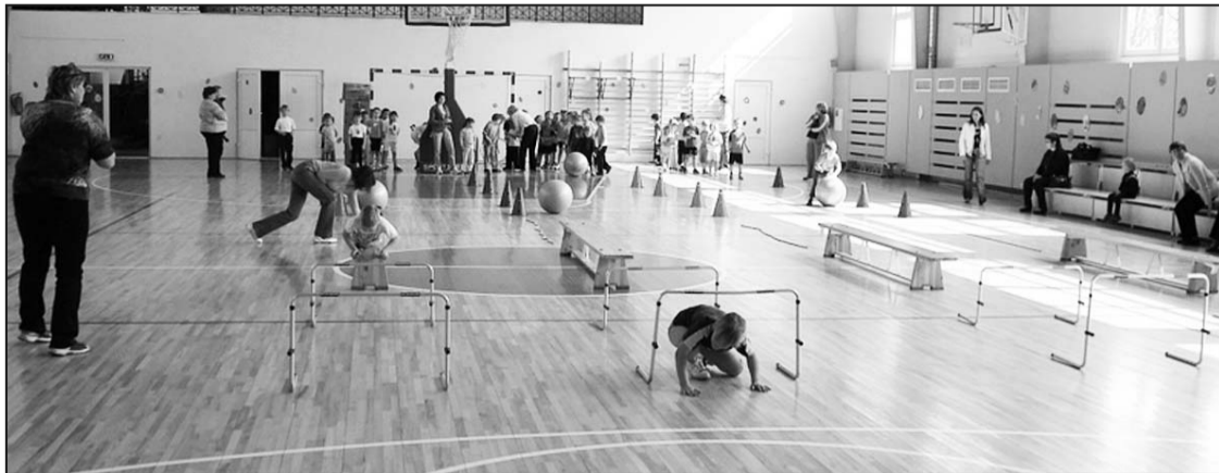
Jautrajās stafetēs Galēnu pamatskolas sporta zālē mazajiem sportistiem bija jādemonstrēja dažādas sportiskās iemaņas un veiklība.