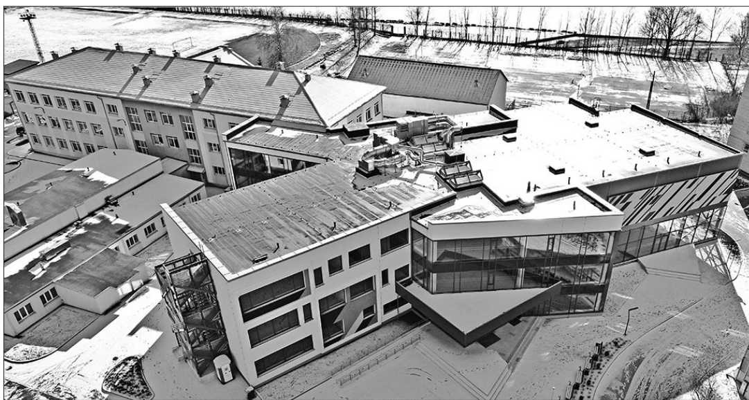
legādātais aprīkojums līdzināsies tam, kāds mācību procesa organizēšanai tiek izmantots citās renovētajās vai no jauna būvētajās valsts skolās.

Aizņēmuma summa palielināta līdz 2,85 miljoniem eiro, un lielāko sadār-