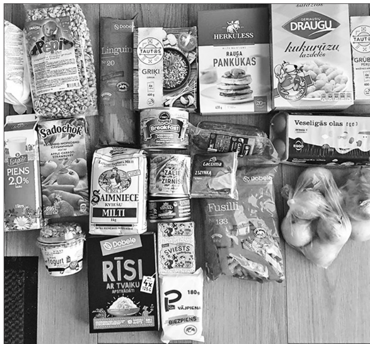
Vecāki atzinīgi izsakās par saņemto pārtiku, daloties ar viedokļiem sociālajos tīklos. Attēlā februārī ANV Lāčplēša ielas ēkas skolēniem izsniegtās pārtikas pakas saturs.