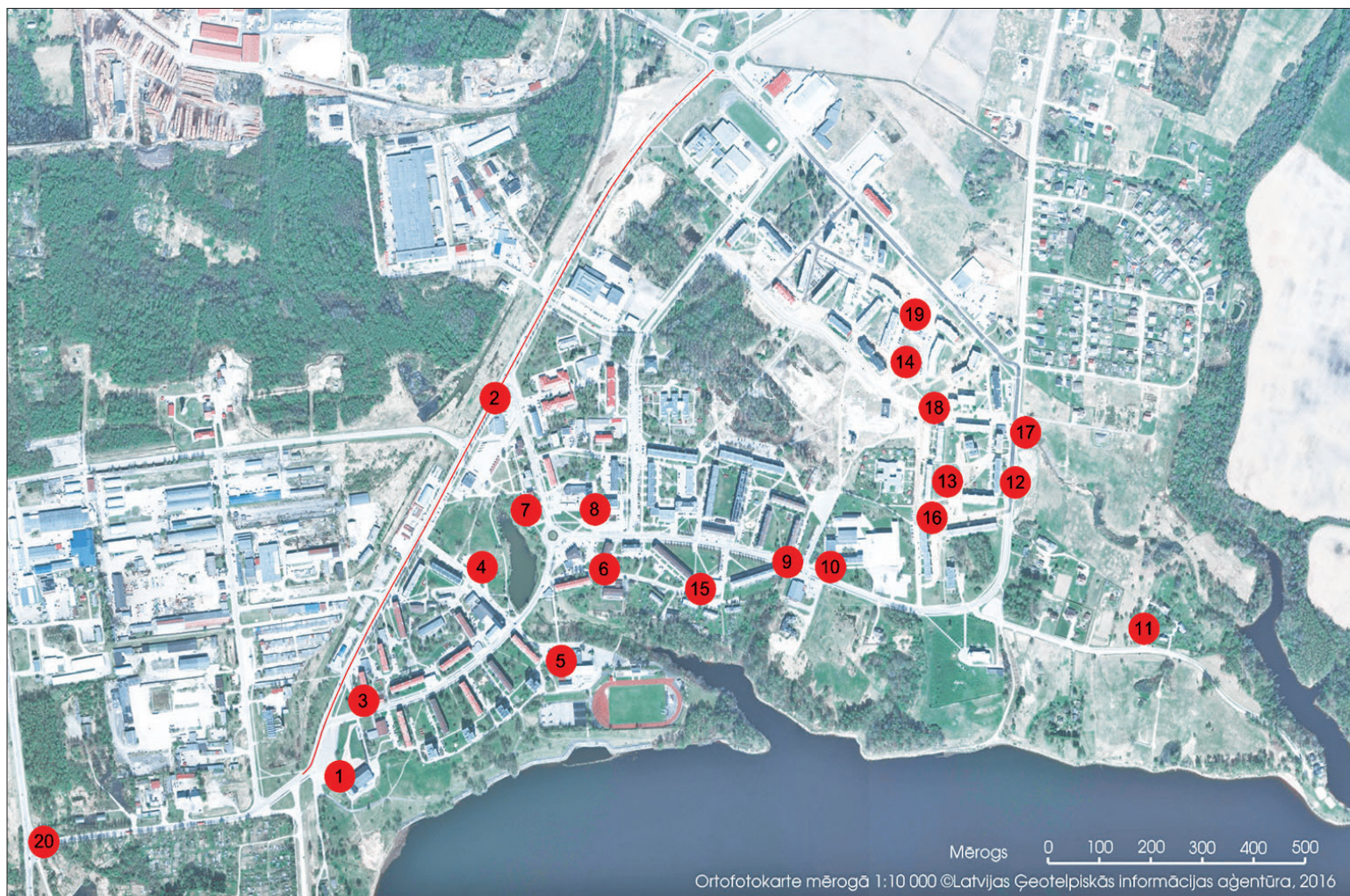
Ortofotokarte mērogā 1:10 000