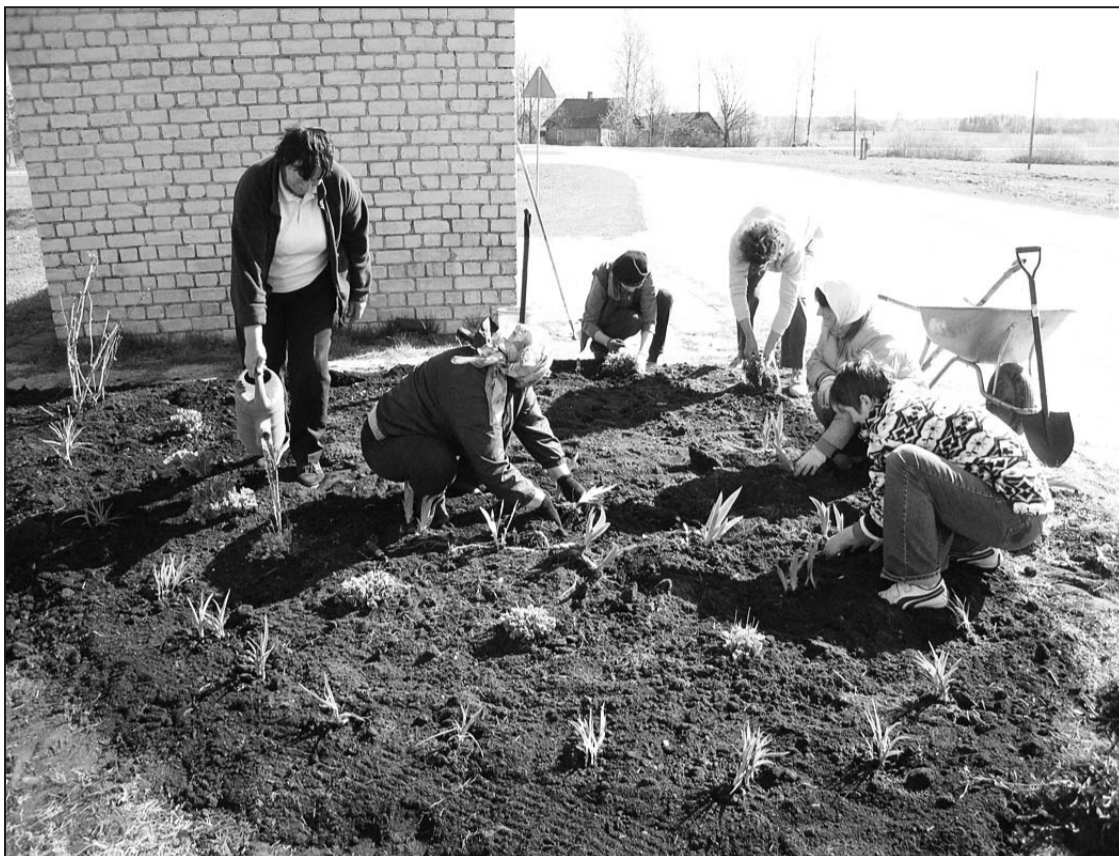
На Большой толоке жители Силюкалнса в центре своей волости посадили красивые цветочные клумбы.