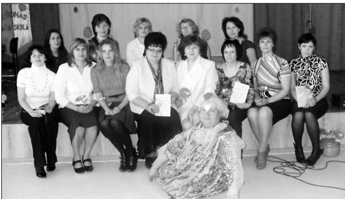
Педагоги дошкольного образования в Рушонской основной школе вместе с коллегами.