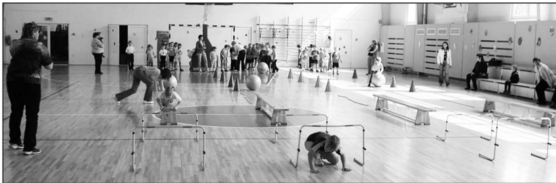
В весёлых эстафетах маленькие спортсмены демонстрировали свои навыки и ловкость.