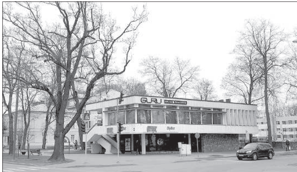
Апрельское утро 2018 года.