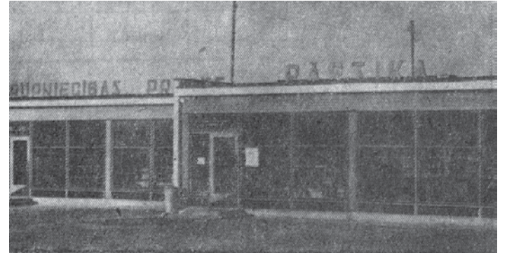
Jaunatveramajā veikalā vēl nepieciešami pēdējie apdares darbi.