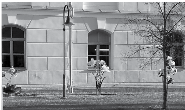
Pie Kuldīgas bibliotēkas uzdzied pavasaris!