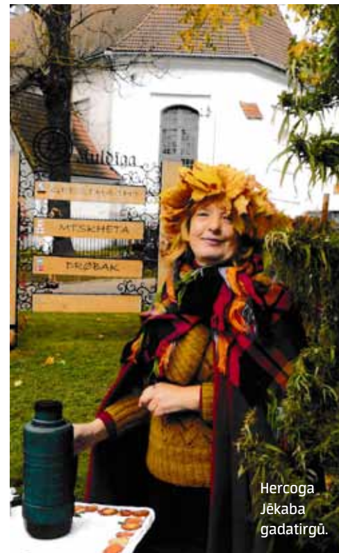
Hercoga Jēkaba gadatirgū.