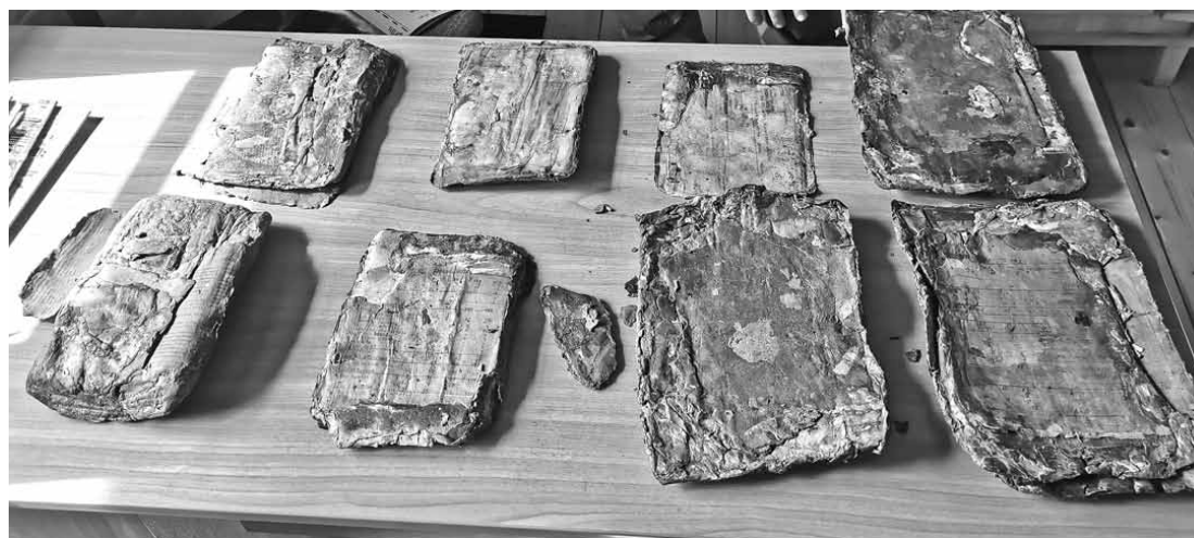
Remtes pagastā atrasts daudz Otrā pasaules kara laika dokumentu. Vēsturnieki cer, ka tie sniegs vērtīgas liecības.

Visi tiks vesti uz Latvijas Kara muzeju, kur eksperti mēģinās katru papīra lapu atdalīt un digitāli iemūžināt, jo oriģinālus saglabāt neizdosies. Ir zināms, ka Robežapsardzības rezerves bataljona štābs atradās Remtes doktorātā.