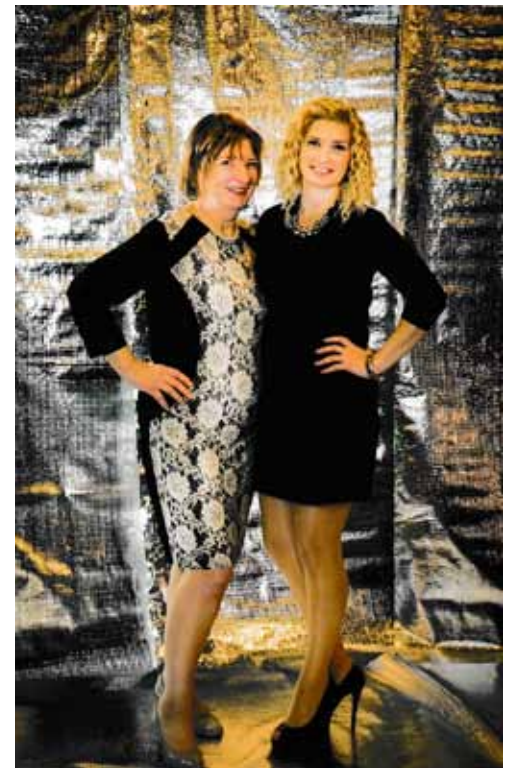
Alise ar meitu Līgu.