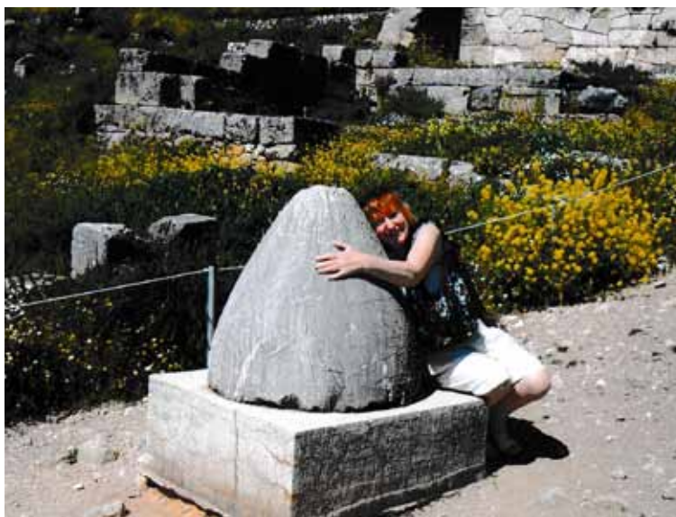
Griekijas Delfos pie Pasaules nabas .