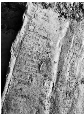
Uz vienas lapas, kas ir sliktā stāvoklī, salasāmi latviešu puīšu vārdi un uzvārdi.