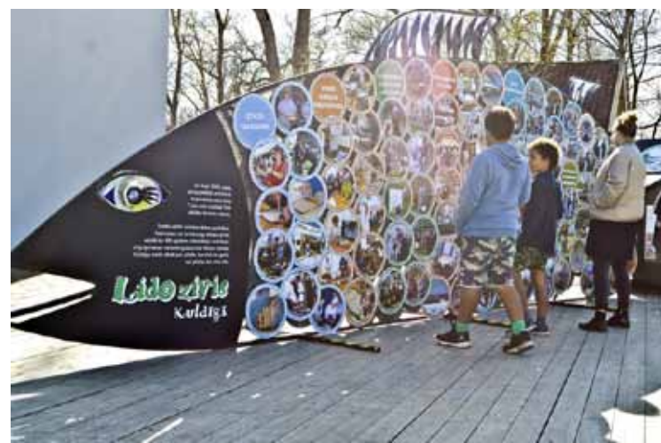
8 m garā vimba Pilsētas dārzā atgādina par notikumiem palu šovā Lido zivis Kuldīgā .