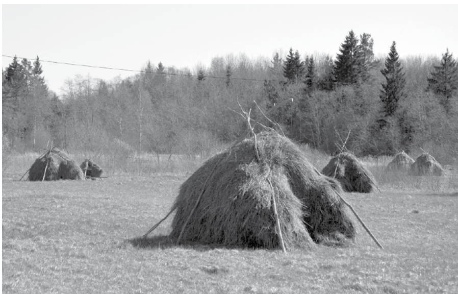
Padurē dzīvojuši taupīgi.