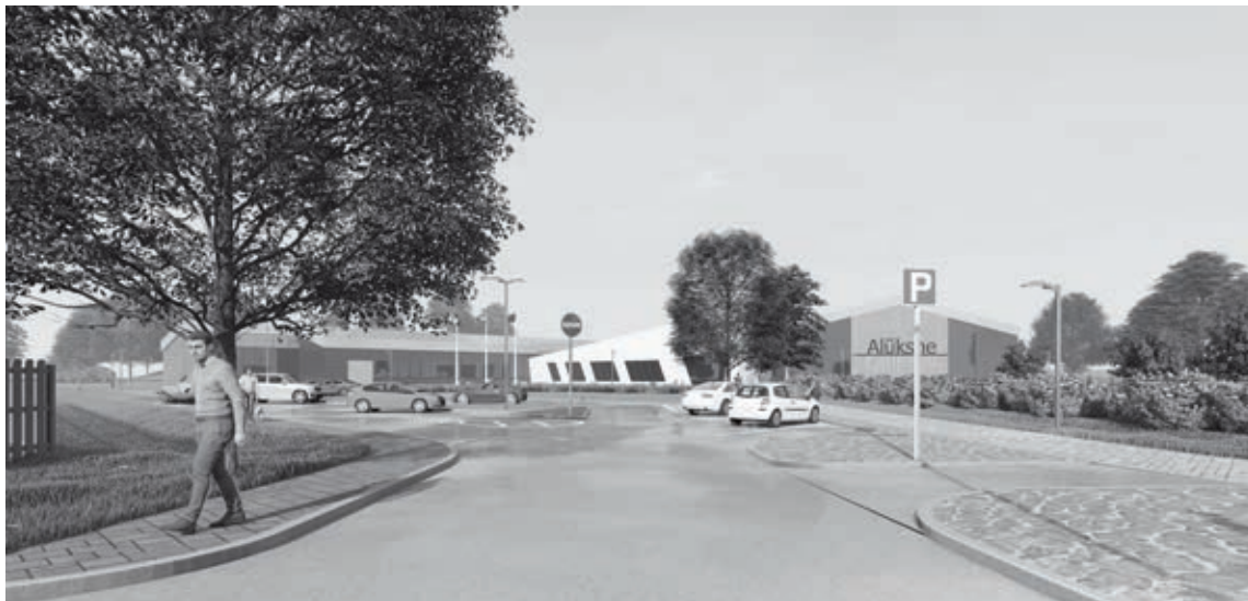
Izglītības un sporta centra vizualizācija

Līdz ar to Vides aizsardzības un reģionālās attīstības ministrijā pieteiktā projekta summa ir 3 529 412 EUR, no kā maksimālais iespējams valsts budžeta līdzfinansējums ir 3 000 000 EUR un pašvaldības