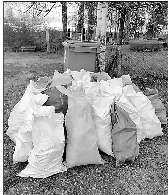
Lai arī droši varam apgalvot, ka ar katru gadu Latvijā top zaļāka, aizvien nākas konstatēt, ka ir pietiekami daudz cilvēku, kas atkritumus atstāj apkārtējā vidē.

Nenosaucot katru individuāli vārdā, ir jāizsaka milzīgs paldies ikkatram, kurš šogad piedalījās un koordinēja Lielās Talkas norisi Riebiņu novadā. Tāpat kā līdz šim, ļoti operatīvi tās pašas dienas pēcpusdienā novadā strādājošais atkritumu apsaimniekošanas uzņēmums nogādāja Lielās Talkas ietvaros savāktos atkritumus Dienvidlatgales reģiona atkritumu apglabāšanas poligonā.