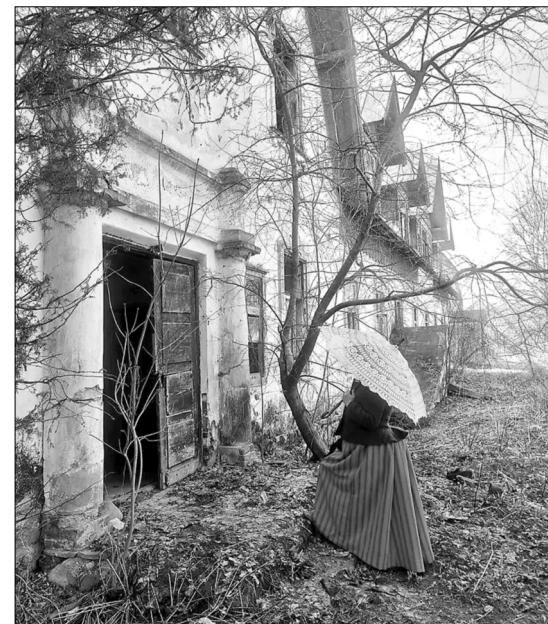
Vērigākie galēnieši pavasara saulē varēja manīt, kā Vidsmuižas bruncī tērpusies galma dāma aplūko Borhu dzimtas Vidsmuižas apbūvi un parku.