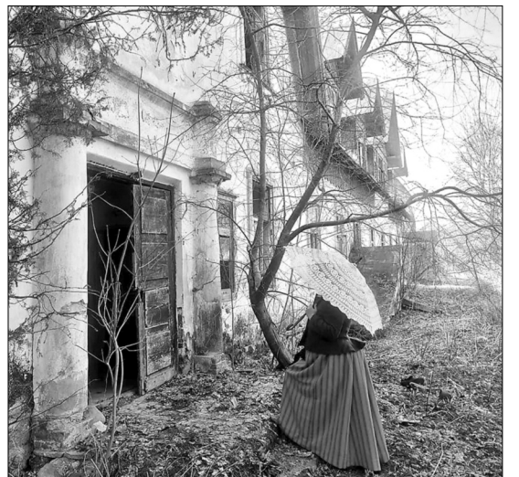
Самые внимательные галяны в свете весеннего солнца могли заметить, как придворная дама, одетая в Видсмуйжскую юбку, осматривает Видсмуйжскую застройку и парк рода Борхов.