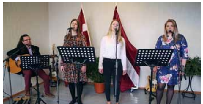
Fragments no Kultūras pārvaldes muzikālā video sveiciena

Tāpat bija kolektīvi, kas izmantoja iespēju piedalīties Tautas tērpu centra “Senā klēts” un biedrības “Mans Tautastērps” rīkotajā akcijā #taustastērpugājiens2021, saņemoties savā tautas tērpā, nofotografējoties un bildi publicējot sociālajos tīklos.