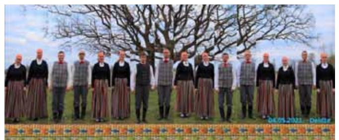
Leimaņu Tautas nama VPKD “Deldze”