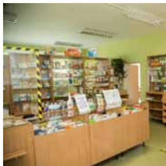
Jēkabpils novada dome 29. aprīlī sēdē lēma uzsākt Jēkab-

pils novada pašvaldībai piederošās SIA "Rubenes aptieka" (reģistrācijas Nr.45403005388, juridiskā adrese: Jēkabpils novads, Rubenes pagasts, Rubeni, "Zelta Sietiņš", LV-5229) kapitāla daļu atsavināšanas procesu, rīkojot izsoli.