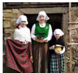
Folkloras kopas “Dignōjiši” meitenes