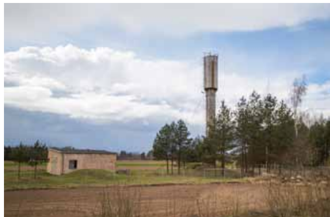
Jēkabpils novada pašvaldība K.Sēja foto

Pēc inženierbūves nojaukšanas līdz 2021. gada 30. jūnijam Jēkabpils novada pašvaldības Finanšu un ekonomikas nodaļai uzdots inženierbūvi izslēgt no pašvaldības bilances, savukārt īpašuma apsaimniekošanas un pakalpojumu sniegšanas nodaļai - izslēgt no nekustamā īpašuma valsts kadastra reģistra datiem.