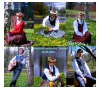
Muzikālā apvienība “Oktāva”