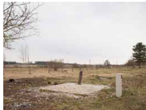
Nojaukts vecās degvielas uzpildes stacijas namiņš Vandānos.