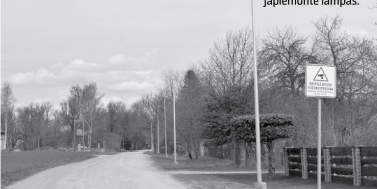
Laternu stabiem vēl jāpiemontē lampas.

No Snēpeles centra līdz pagasta robežai Laidu virzienā aptuveni 500 metrus tiek ierīkots apgaismojums.