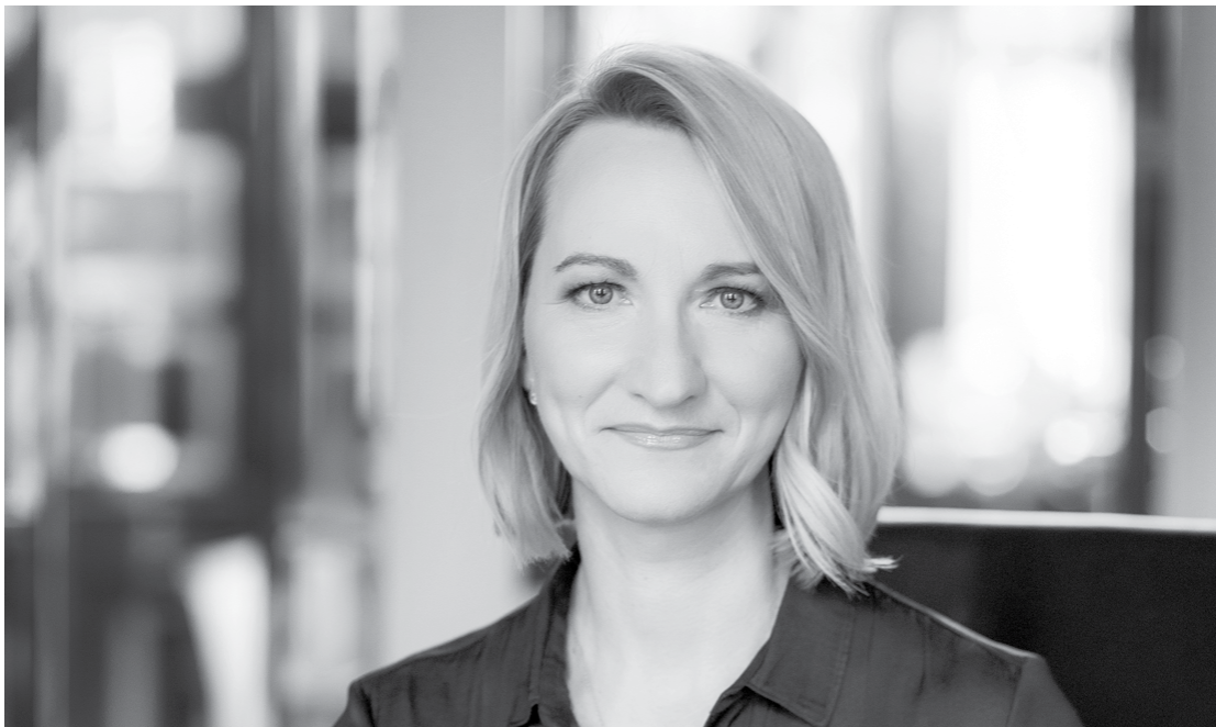
Eiropas Parlamenta deputāte Dace Melbārde.

Lai arī sākotnēji konferenci bija plānots sākt jau pagājušajā Eiropas dienā 9. maijā, pandēmijas uzliesmojums apvienojumā ar institucionālajām nesaskaņām ir rezultējies krietnā aizkavē. Pirmais strupceļš radās jau 2020. gada sākumā, kad Eiropas Parlaments liberāli Giju Verhovstatu norīkoja kā savu izvēli konferences prezidentam. Cita starpā pret to – ne bez pamata, ņemot vērā šī kunga federālistisko redzējumu par Eiropu, – iebilda virkne dalībvalstu. Lai samierinātu dažādās puses, galā panāktais kompromiss paredz ne tikai Parlamenta, bet arī Komisijas un Padomes priekšsēdētāju trio konferences vadītāju krēslus. Tomēr papildus tam būs arī izpildvalde, kas savukārt sastāvēs no trim pārstāvjiem un četriem novērotājiem no katras iepriekš piesauktās ES institūcijas.