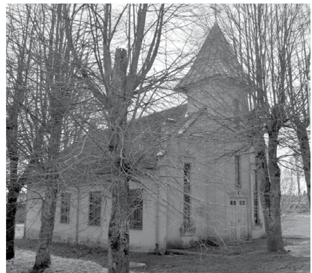
Snēpeles autonomā evaņģēliski luteriskā baznīca ar pašvaldības palīdzību pirks elektriskos sildītājus sēdvietām.

Lappuse tapusi ar Kuldīgas novada pašvaldības līdzfinansējumu.