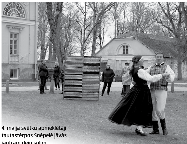
4. maija svētku apmeklētāji tautastērpos Snēpelē jāvās jautram deju solim.

Austas segas, skanīgas dziesmas, cilvēki tautastērpos, vējā plīvojošs valsts karogs un balts galdauts Latvijas Republikas Neatkarības atjaunošanas dienā pie Snēpeles muižas radīja īpašu gaisotni.