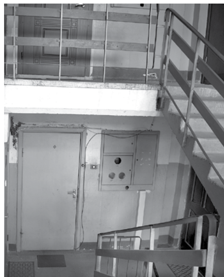
Vālodzīšu kāpņu telpu iemītnieki remontēs ar konkursa Darīsim paši atbalstu.