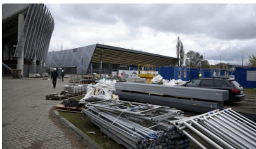
Daugavas stadiona treniņu halle būvniecības procesā 8. maijā