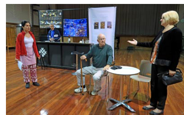
Lugas "Liču vilinājums" mēģinājums