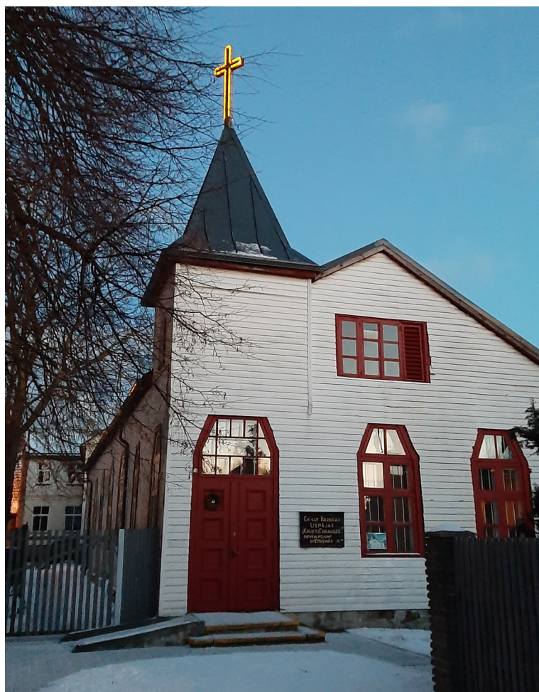
Liepājas Krusta evaņģēliski luteriskās draudzes nams