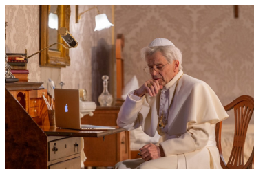
Michails Barišņikovs filmā

Jaunajā Rīgas teātrī noslēgusies kino darba "Baltais helikopters" filmēšana, radošā grupa ķersies pie pēcapstrādes darbiem, un ceļu pie skatītājiem visā pasaulē filma varētu uzsākt gada nogalē, vēsta Latvijas Radio. Ļoti aktuāla, pat skandaloza tema, ko izspēlēja pasaules līmeņa aktieris un kas ietērpta izsmalcinātā vizuālā veidolā – šos par savas topošās filmas trim galvenajiem trumpjiem uzskata režisors Alvis Hermanis. Filmas pamatā ir Hermaņa pirms pusotra gada iestudētās izrādes motīvi, taču tā nav uzfilmēta izrāde, bet gan pilnīgi autonomas kino darbs, kam būs arī nedaudz no izrādes atšķirīgs sižets.