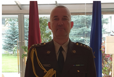
Pulkvedis Jānis Dreimans

Krievija izraidījusi Latvijas aizsardzības atašeju, pulkvedi Jāni Dreimani, paziņojusi Latvijas Aizsardzības ministrija (AM). Krievijas Ārlietu ministrija 28. aprīlī pavēstīja, ka no valsts izraida septiņus Baltijas valstu un Slovačijas diplomātus.