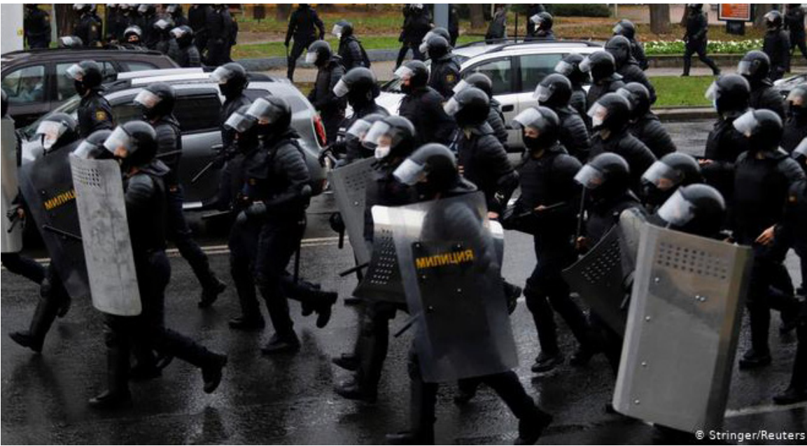
Minska, 21. gadsimts...

Atvadāmie ar cerību, ka vēl redzēsīmes. “Jūs esat tik ļoti cilvēki! Paldies jums visiem un Latvijai! Divas nedēļas beidzot varējām naktis mierīgi gulēt un atpūsties, justies kā cilvēki. Paldies!”