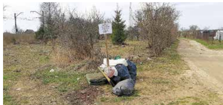
Ir nomnieki, kuriem patīk atkritumu kaudzes pie mazdārziņa.

Kas ir jā dara, lai mazdārziņu nomnieki kļūtu atbildīgāki un pārtrauktu mēslošanu? Tie taču ir pieauguši un it kā prātīgi cilvēki! Speciālos marķētos atkritumu maisus jau tagad var saņemt Valsts un pašvaldības vienotajā klientu apkalpošanas centrā Salaspils domē Līvzemes ielā 8, Salaspilī, un Saulkalnes Klientu apkalpošanas centrā, un par to atstāšanu iebildumu nebūs. Tomēr atļaujiet pavaicāt: ja bioloģiskos atkritumus liekat