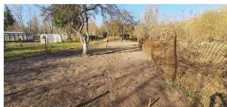
Mazdārziņš "pirms" un "pēc".

par to, ka viens Salaspils novada gabaliņš nu ir sakopts, un nav nozīmes, cik tas ir liels vai neliels. Pilnīgi noteikti padarītais darbs dod lielāku gandarījumu