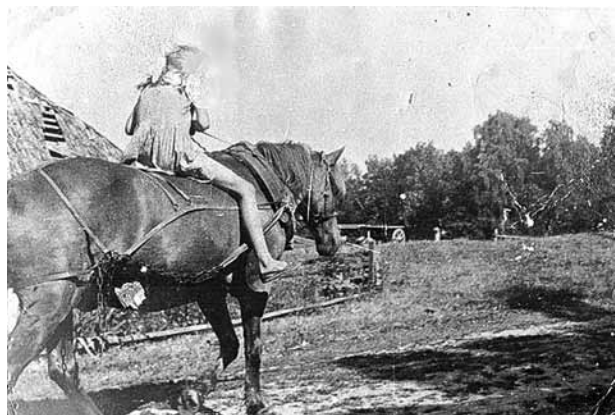
Savās mājās Dzērvēs Aina ar darbarūķi Ēzelīti bieži devusies palīgā darbos.

„Pirms pandēmijas katru reizi bijām citā vietā un apvienojām divus vienā: nūjošanu un ekskursiju.”