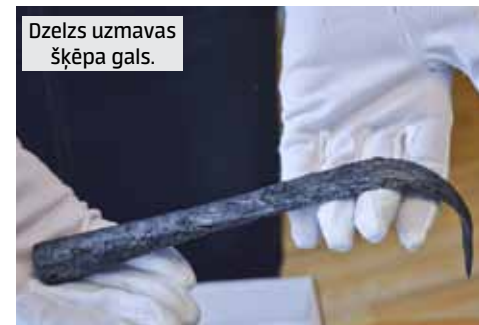
Dzelzs uznavas šķēpa gals.