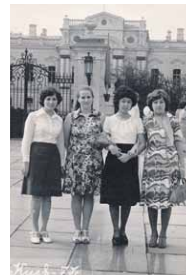
Jaukais studiju laiks Kijevā.