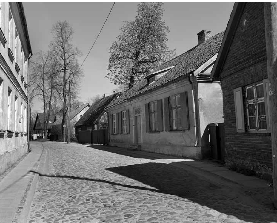
Vēl 18. gadsimtā Rumbas ielas kreisajā pusē bijušas vien trīs mājas, pārējās uzbūvētas 19. un 20. gadsimtā.