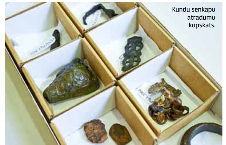
Kundu senkapju atradumu kopskats.

Kundu senkapji atklāti 2016. gada pavasarī, kad Valsts kultūras pieminekļu aizsardzības inspekcija (VKPAI; tagad Nacionālā kultūras mantojuma pārvalde) saņēma ziņojumu par mantraču postījumiem un senlietu atradumiem valsts