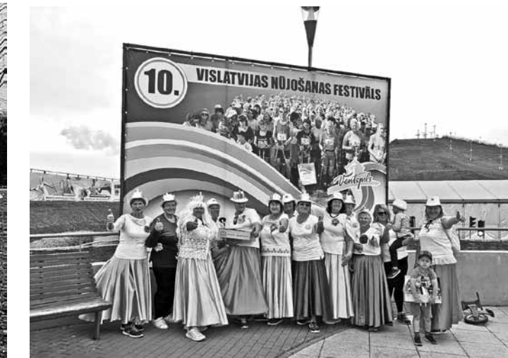
Interesešu kopa Dzērvēs Latvijas nūjošanas festivālā Ventspilī.

vairāk nekā 200 lopu. Tie bija ļoti agri rīti un vēli vakari. Bijām pirmrindnieces – katru gadu mūs apbalvoja par labu darbu, par brīvu braucām ekskursijās. Man piešķīra divstābu dzīvokli tikko celtā daudzdzīvokļu mājā. Nostrādāju līdz kolhoza likvidācijai. Bet mājās bija pašiem sava saimniecība. Agrāk – sešas govīs, jaunlopi, zirgi. Zeme tālu – braucām uz Maskavu, Ļeņingradu. Sodien palicis viens teliņš, vistas un zirgs. Daudz braucu ar auto, un citādi tagad nevarētu – autobuss kursē reizi dienā. Kādas vēl jums tagad aizraušānās? Agrāk daudz adīju, tamborēju, mezgloju. Jo sarežģītāks raksts, jo labāk. Tagad vairs neadu – sāp rokas. Bet cepu pīrāgus un mājās kūkas. Vēl man patīk dejot tautiskās visus gadus dejuju Laidu as-