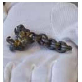
Bronzas dubultriņķišu važiņas fragments.