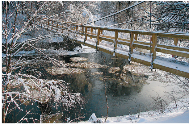
Tilts pār Salacu.

Pa Parka ielu, cauri tunelim, kurā apskatāmi Staiceles MMS gleznojumi par tēmu Esmu iebriedis Salacas upē... 27.83447; 24.74511