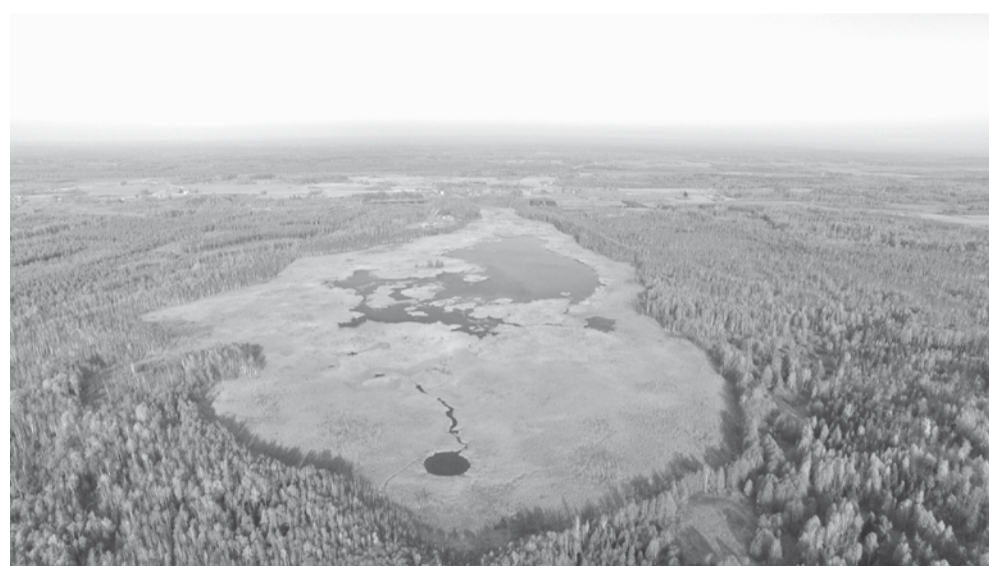
Silabebru ezers ir dabas liegums, «Natura 2000» teritorija. Tā ir nozīmīga ūdensputnu (melnais zīriņš, lielais dumpis, Seivī ļauķis u.c.) ligzdošanas vieta un aizsargājamās augu sugas – lēzeļa lipares – atradne, kā arī rets biotops – mezotrofa ūdenstilpe.

Kādreiz ziemā zivis slāpušas, bet tagad,