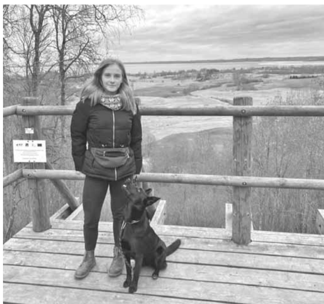
ar sunīti Noru Mākoņkalnā.

Pavadītais laiks kopā ar suni ir pats labākais, kāds vien var būt, jo suns uzklausa mani vienalga kad, vienalga par kādām tēmām un arī ja izdarīšu kādu muļķību, tad suns būs tas, kurš pievienosies un priecāsies par to, nevis nosodīs.