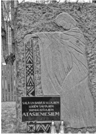
Šogad apritēs 80 gadi kopš pirmās masu depor-

tācijas, kad 1941. gadā padomju režīms izsūtīja vairāk nekā 15 tūkstošus Latvijas pilsoņu. Atceroties šo noziegumu, 14. jūnijā vienlaikus visā valstī, arī Krustpils novada pašvaldībā – Atašienes pagastā pie baznīcas, lasīs izsūtīto iedzīvotāju vārdus.