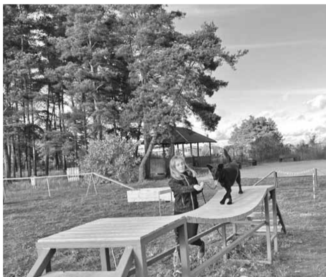
ar mīluli Noru treniņā