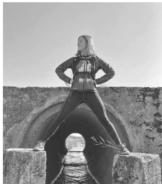
Uzdrīksties pamēģināt! Pirmo reizi saņēmos noorganizēt jau sen iecerēto pārgājienu gar Donaviņas upi ar uzdevumu pēc iespējas vairāk reizes šķērsojot to, iesaku ikvienam, tomēr šo maršrutu labāk izvēlēties pavasarī, kad koki un krūmi nav saplaukuši.

rakstiski, un citiem ne vienmēr atklāju pierakstīto.