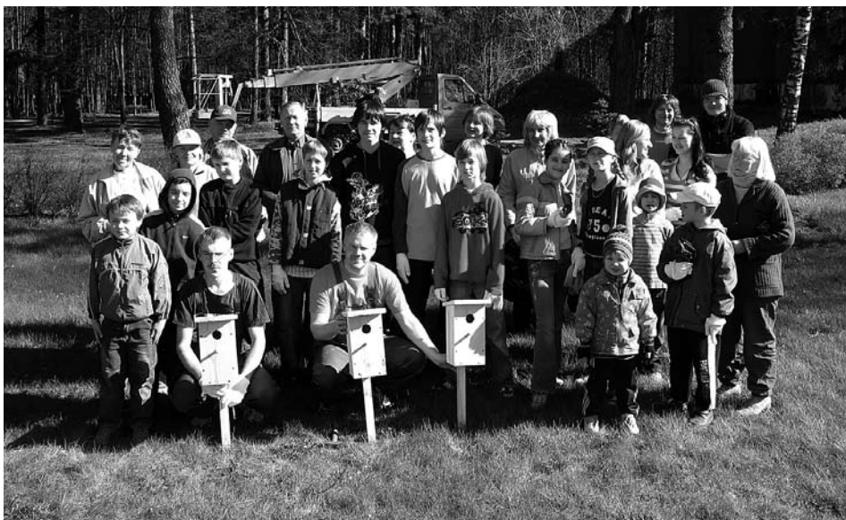
ULBROKAS STRĀDĪGIE TALCINIEKI.

26.aprīlī Stopiņu novadā rosījās tie iedzīvotāji, kuriem nav vienaldzīga mūsu apkārtējā vide, kurā paši dzīvojam un atpūšamies. Jāteic, gan, ļoti žēl, ka Ulbrokā iedzīvotāju atsauce ir nesalīdzināmi mazāka nekā Sauriešu, Upesleju, Cekules un Līču ciematos. Jā, var jau teikt un domāt, es jau nemēsloju, kam man jāvēc, bet... pa apkārtējiem mežiem mums visiem patīk pastaigāties, vai tiešām vienreiz gadā ir tik neiespējami visiem kopā savākt vismaz to lielumu atkritumu, kuri diendienā ir mūsu acu priekšā. Jā, var jau arī teikt, ka tie ir Rīgas meži, lai Rīga satīra. Bet tā mēs gaidīsim gadus 10-15 un tad jau tiešām mežā ieiet nevarēs... Ciematu centrus, ezermalu, un sabiedrisko objektus mēs cenšamies uzturēt tīrus un kārtīgus, bet cilvēki jau pamanās atstāt aiz sevis pakas, pudeles un papīrus pat stundu pēc sakopšanas.