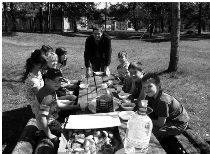
LĪČU TALCINIEKU ATPŪTAS BRĪDIS.