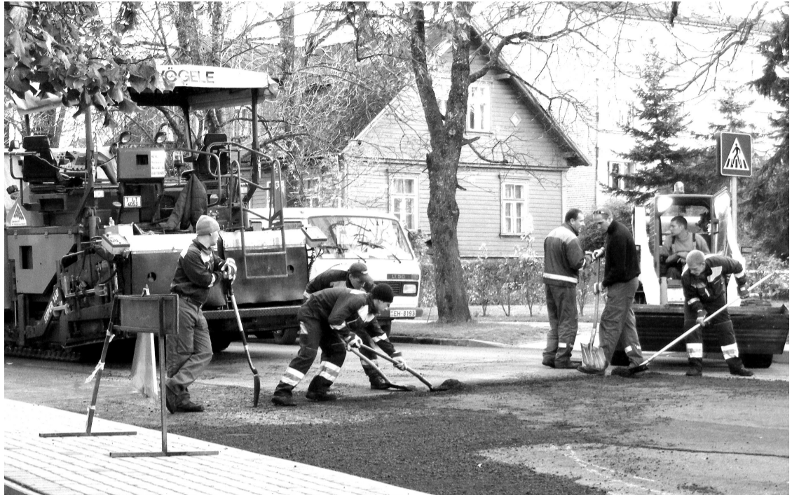
SIA "Ceļinieks 01" ieklāj jauno asfalta segumu Tirgotāju ielā

Seguma renovācija notika vairākās ielās. Pirmā pozitīvas pārmaiņas piedzīvoja Latgales iela, kur tika atjaunots segums, izveidojot optimālu ielas profilu, kā arī daļēji sakārtojot lietussūdens kanalizācijas sistēmu. Ietvei Latgales ielā gan pagaidām saglabāts vecais segums, jo, tā kā zem ietves plānots ieguldīt