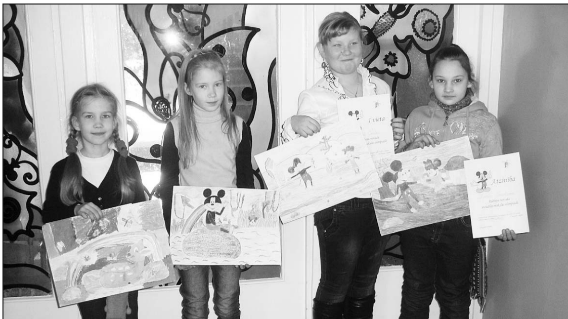
Jaunākās grupas laureāti ar saviem darbiem.

16. februārī Riebiņu vidusskolā notika Riebiņu novada vizuālās mākslas olimpiāde.