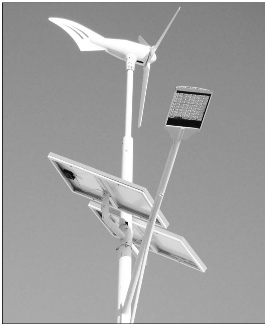
Uzstādītās hibridlaternas pie Riebiņu vidusskolas.