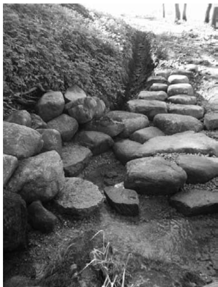
Pirmais avots pie viesu nama “Ūdenszirnas” (jau notiek labiekārtošanas darbi).