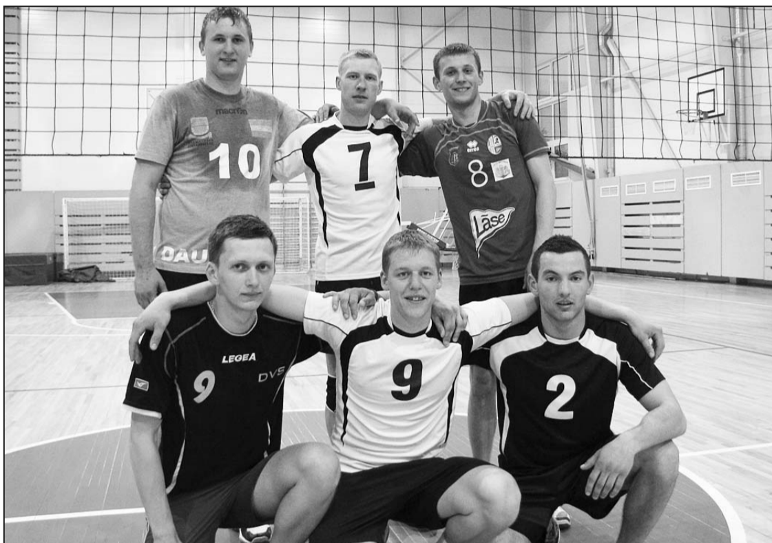
Сильнейшие команды открытого турнира по волейболу Риебиньского края 2013 года – Прейльская полиция и Блокада.

В этом году была продолжена традиция проводить открытый турнир по волейболу Риебиньского края весной, а не осенью. 22 марта этого года в спортивном зале Гаянской основной школы соревнования начались 8 мужских волейбольных команд и 3 женские команды.