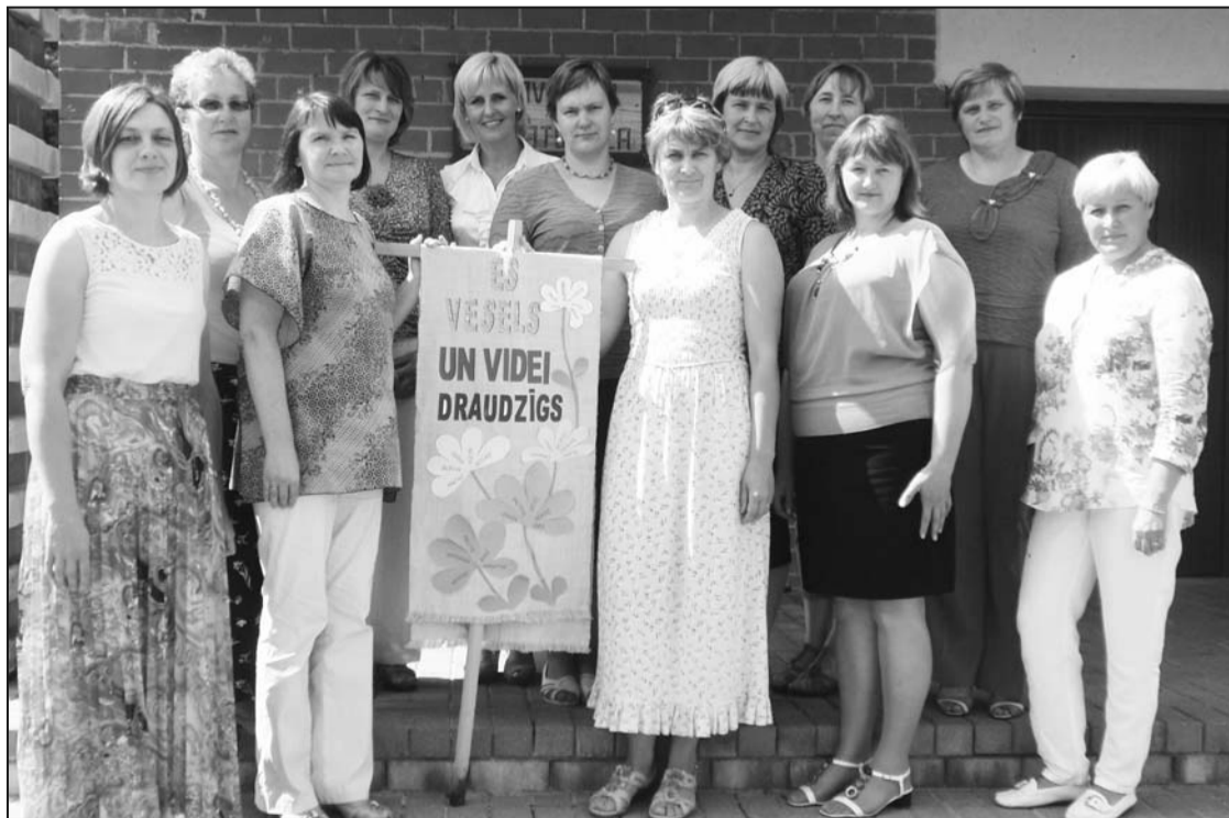
Реализаторы и партнёры по сотрудничеству проекта «Едины в мыслях и делах!»

Благодаря финансовой поддержке Риебиньской краевой думы, у участников проекта была возможность отправиться в экскурсию на завод по производ-