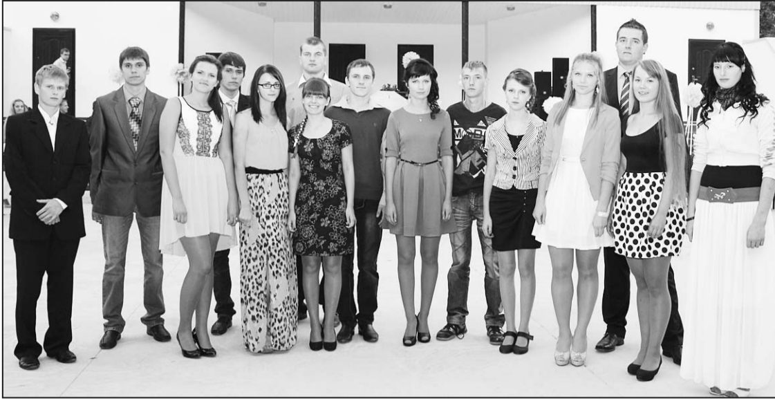
После праздника – традиционная общая фотография.

У времени общеизвестная особенность – оно спешит вперёд, считая секунды, минуты, месяцы, годы... Кажется, ещё вчера они были маленькими детьми, а сегодня – делают свои первые шаги во взрослую жизнь.