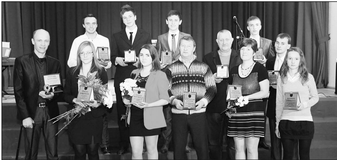
Общая фотография лауреатов Вечера спорта 2013.

Чтобы поздравить лучших и самых успешных спортсменов и оглянуться на спортивные достижения, традицией в крае стала организация Вечера спорта. Уже в седьмой раз спортивная семья собирается на спортивный вечер Риебиньского края, в этот раз – в новом центре культуры Риебиньского края, где, между прочим, в далёком 2006 году состоялся первый Вечер спорта Риебиньского края.