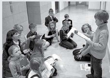
Mirklis no viesošanās ASV vēstniecībā