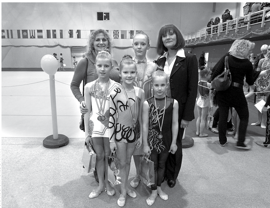
Mākslas skolas vingrotājas kopā ar trenerēm