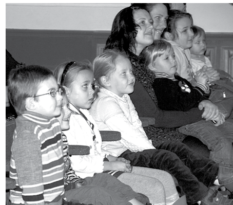
Vēro teātra uzvedumus