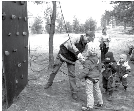
Klinšu sienas iekarotāji