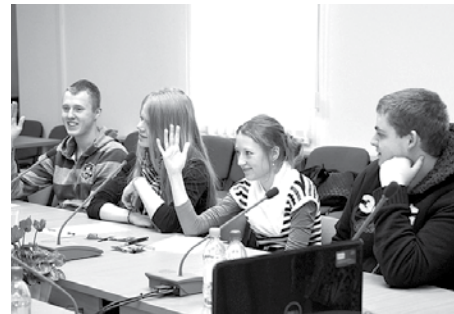
Online diskusija jauniešiem