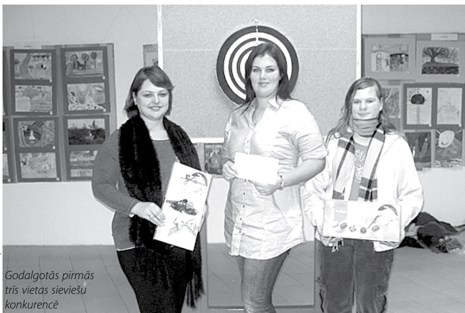
Godalgotās pirmās trīs vietas sieviešu konkurencē