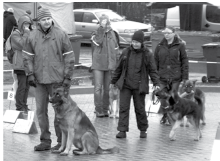
Suņu paklausības rallijs