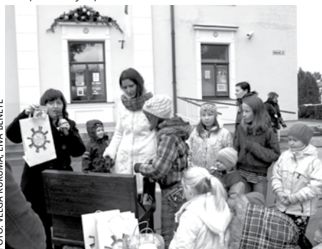
Vēlējumu lāde pilsētā