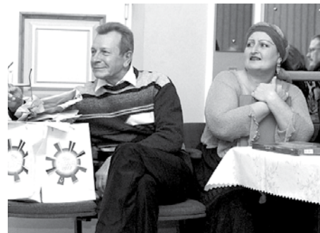
Detektīvu kluba vakars