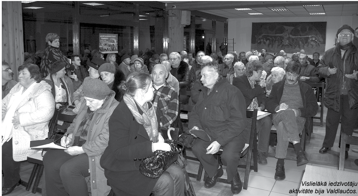
Vislielākā iedzīvotāju aktivitāte bija Valdlaučos.

Tāpat sanākušie akcentēja dažas ar vidi saistītas problēmas. Viens no sāpīgākajiem jautājumiem ir tas, ka daudzi privāto māju īpašnieki nav noslēguši līgumu par atkritumu apsaimniekošanu, tāpēc savus sadzīves atkritumus izmet daudzdzīvokļu māju atkritumu konteineros. Pašvaldības policija aicināja iedzīvotājus būt vēriem un ziņot (var arī anonīmi) par šādiem gadījumiem,