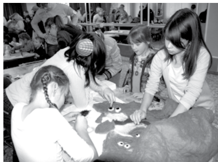
Radošās darbnīcas bērniem