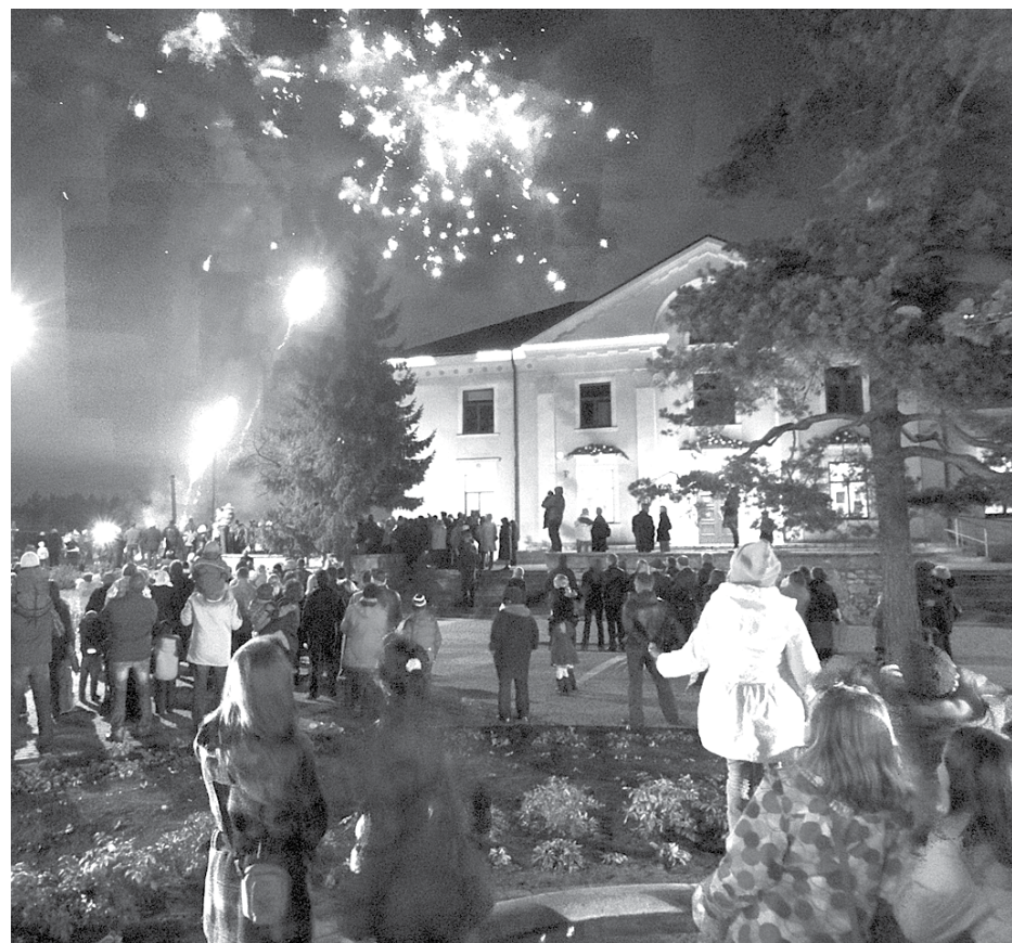
Svētku salūts Baložu pilsētā

Kaut arī nelabvēlīgie laika apstākļi aizbiedēja mazo sunīšu īpašniekus, kas bija iepriekš izteikuši vēlmi piedalīties šajās sacensībās, tomēr 15 izturīgākie un drosmīgākie suņu saimnieki ar saviem mīļajiem braši startēja suņu paklausības rallijā.