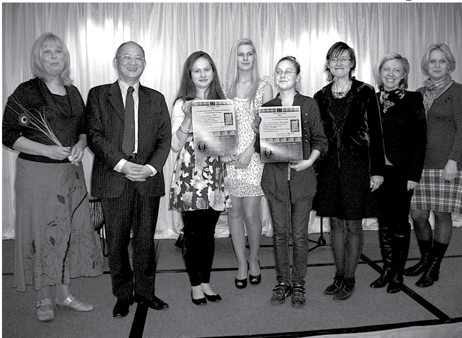
Saņemot atzinības sertifikātus Taipejas Misijas Latvijas pārstāvniecībā Rīgā

Nesen noslēdzies 42. Starptautiskais bērnu mākslas konkurss Ķīnā, Taivānā. Konkurss ir viens no lielākajiem pasaulē, un šogad tajā piedalījās 53 valstis ar vairāk nekā 30 000 darbu, 1135 no tiem saņēma dažādas pakāpes sertifikātus.