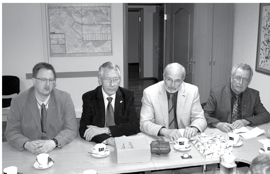
Bordesholmas pārstāvji, viesojoties Ķekavas novada Domē

1. decembrī Ķekavas novada pašvaldībā darba vizītē ieradās pārstāvji no Bordesholmas pašvaldības (Vācija), lai pārrunātu sadarbības plānus