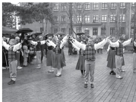
Jubilejas deju priekšnesumi