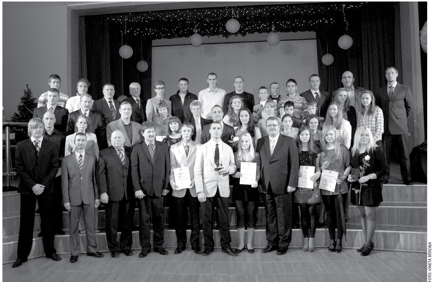
Ķekavas novada sporta laureāti 2011