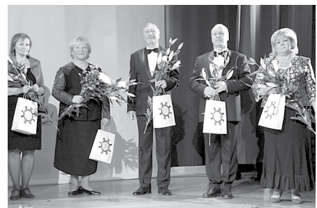
Godina kultūras darbiniekus