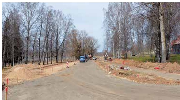
Levu ielas pārbūves darbu beigām, šajā posmā esošo ielu un gājēju celiņu segums būs atjaunots. LAV