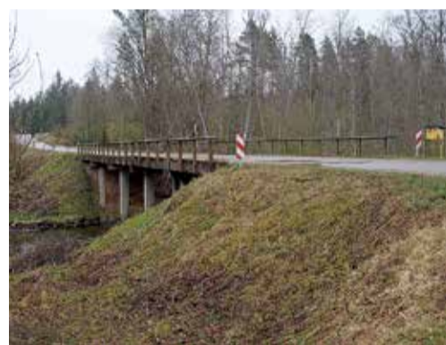
Tilts pār Svētupi, Pāles pagastā.

Tuvākajās dienās Limbažu novada pašvaldība plāno slēgt līgumu par Limbažu novada pašvaldības tiltu remontdarbiem Limbažu novadā, kā arī grants seguma ceļu remontdarbiem Pāles un Viļķenes pagastos.