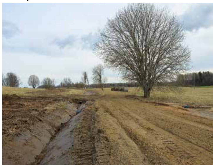
Umurgas pagasta autoceļš "Krocas – Klētnieki - Laigas" uz kura remontdarbi jau noslēgušies.

"Krocas – Klētnieki - Laigas" tiek veikta apauguma noņemšana, grāvja rakšana, caurtekas iebūve un seguma remontdarbi, ceļam "Ķītas - Krūciems" apauguma noņemšana seguma remontdarbi, bet ceļam "Krogzemji - Roniņi" caurteku remonts. Seguma remontdarbus veiks arī Vidrižu pagasta autoceļam "Zemnieki