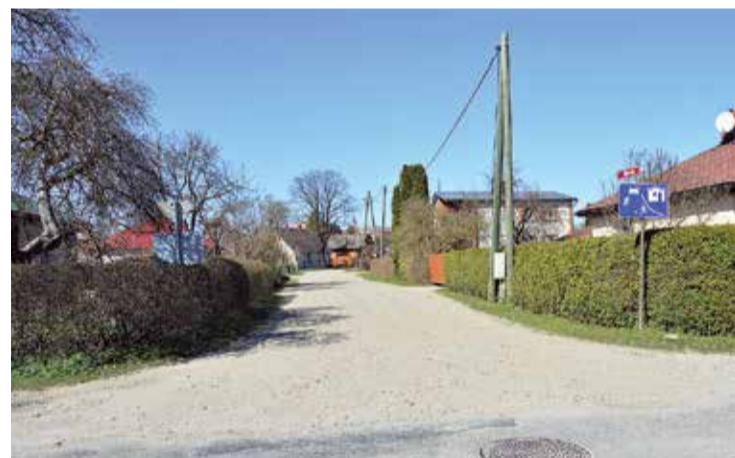
Zāles iela posmā no Valmieras ielas līdz Strautu ielai, kurai veiks apauguma noņemšanu, grāvja tīrīšanu, divkārto virsmas apstrādi ar granīta šķembām un karstā asfalta dilumkārtas būvniecību.

Limbažu novada pašvaldība 19. aprīlī noslēdza līgumu par Limbažu novada ielu remonta būvdarbu veikšanu.