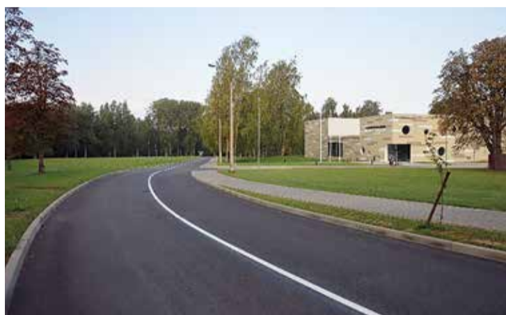
Jaunatnes iela un Parka iela pēc pārbūves darbu beigām 2018. gadā.

Atgādinām, ka 2018. gadā par 66 425,44 EUR Limbažu novada pašvaldība veica Jaunatnes ielas pārbūves darbus un Parka ielas pārbūves darbus (posmā no Sporta ielas līdz Limbažu peldbaseinam) par 104 730, 96 EUR. Līdz ar