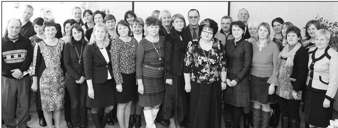
Участники советов школ уже в пятый раз собираются вместе, и всегда – традиционная общая фотографии.

19 февраля этого года в Дравниекской основной школе встретились представители советов учебных заведений Риебиньского края.