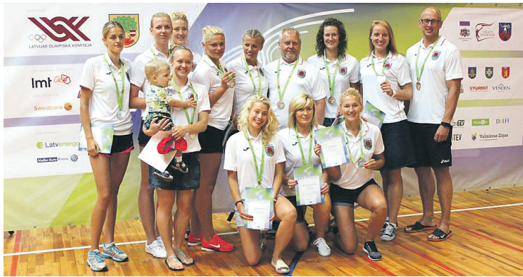
Sudraba godalgas ieguvējas – sporta kluba „Babīte” volejbolistes.