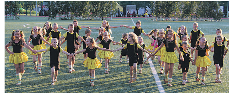
Festivālā „Soļi smiltīs” sievas, vīri un bērni izdejoja vasaras sajūtas.