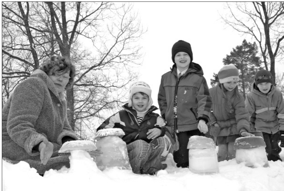
Foto 2.klase ar audzinātāju pie saviem projektu darbiem

Vērojot padarīto, visiem bija gandarījums par paveikto.