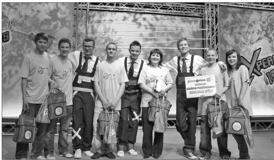
Foto: Latvenergo erudīcijas konkurss skolēniem "eXperiments" pusfināla spēle ierakstu studijā.