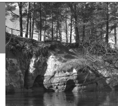
Raganu klintīs Vaidavas upes krastā. Ape, Apes novads