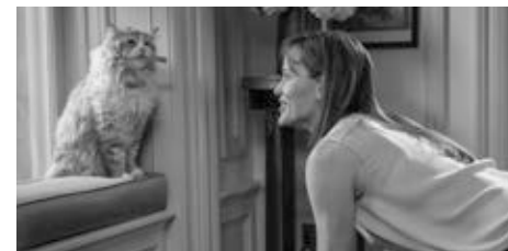
Vokens (Christopher Walken).

Lomās: Kevins Speijsijs (Kevin Spacey), Dženifera Gārnera (Jennifer Garner), Kristofers