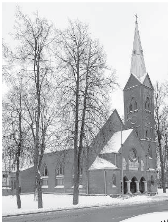
Рождество 2018 года.

«Священник, увидев пламя в храме и спеша его потушить, не видел вблизи никого, кто мог бы помочь. Несмотря на это, свя-