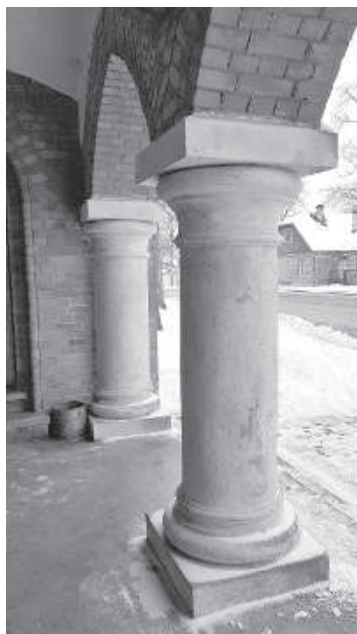
Колонны возле главного входа.

В годы Атмоды храм медленно возрождался. «Резекненские