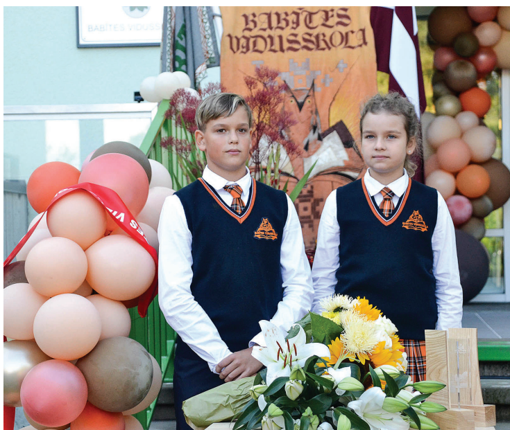
2020. gads, piebūves atklāšana.

savukārt 91% vecāku iestādes vidi novērtē kā drošu. Sarunā ar eksper-