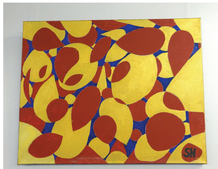
Santas Nagobades gleznu izstādē „Pārsteigums”.

Ināra Pētersone, Piņķu bibliotēkas bibliotekāre