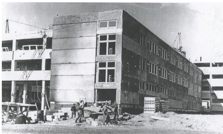
1980. gads, skolas celtniecība.

Varam lepoties ar saviem pedagogiem, jo gala ziņojumā Akreditācijas komisija secināja, ka Babītes vidusskolas pedagogiem ir izpratne par efektīvu mācību stundu, tās uzbūvi, metodēm un darba formām. Tas veicina izglītojamo interesi, līdzatbildību un personības izaugsmi. 81% no vērotajām mācību stundām tika sniegta uz izaugsmi orientēta atgriezeniskā saite. Visās mācību stundās bija vērojama labvēlīga sociāli emocionālā gaisotne starp skolēniem un pedagogu, kas veicina izglītojamo un pedagogu efektīvu sadarbību. Balstoties uz Edurio anketu datiem, Akreditācijas komisija secināja, ka 95% izglītojamo skolā jūtas droši un nav saskārušies ar mobingu no klasesbiedru vai skolābiedru puses,