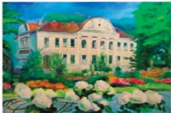
"Pilsētas dome un parks", autore Rasma Rinkēviča.

Jau kopš senatnes cilvēki vislabprātāk apmetās upju tuvumā. Ūdens garantēja papildus drošību, kā arī kalpoja par svarīgu tirdzniecisko sakaru līdzekli gan ar tuvākajiem kaimiņiem, gan tālākām zemēm. Daugavas krastos ir arī mūsu skaistā, senā pilsēta Jaunjelgava, kuru trīspadsmit lielformāta eļļas gleznās atainoja gleznotājs no Jaunjelgavas, Daudzevas un Aizkraukles.