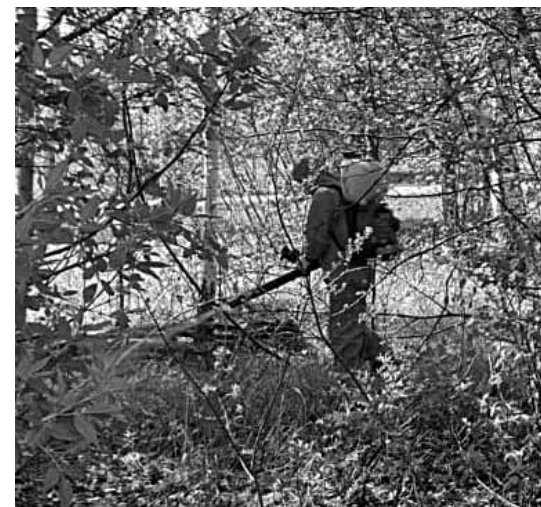
Latvāņi tiek migloti pašvaldības īpašumā Kuldīgā, Ēdoles ielā 51.