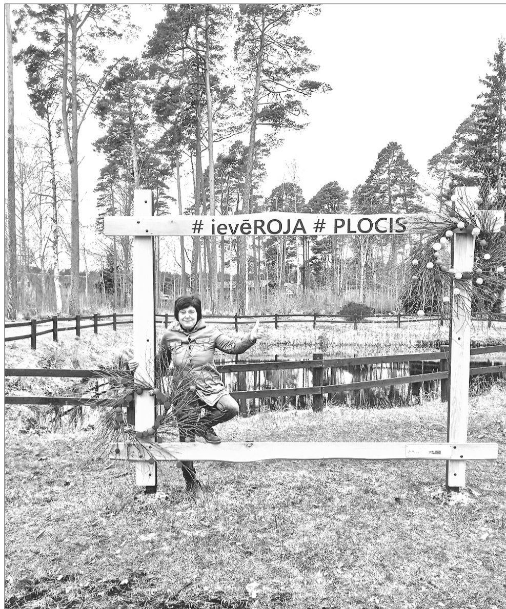
Dacei plocī darba netrūkst nekad.

Cilvēkiem ir jāsaprot, ka katrā vietā ir savi noteikumi, kas nosaka apstādījumu kopšanu. Piemēram, ja kādam dārzā aug skaista egle un viņam tā sāk traucēt vai ir apnikusi, to vairs nevar tā vienkārši nozāgēt, jo tā jau ir iekļāvusies kopējā ainavā. Par to visu ir jāpadomā, arī par to, cik tuvu tu stādi kokus pie kaimiņu žoga. Rojas novada iedzīvotāji ļoti kopj savus īpašumus, stāda un lolo. Tūlīt ziedēs forsītijas un dārzi slīgs dzeltenās kupenās,