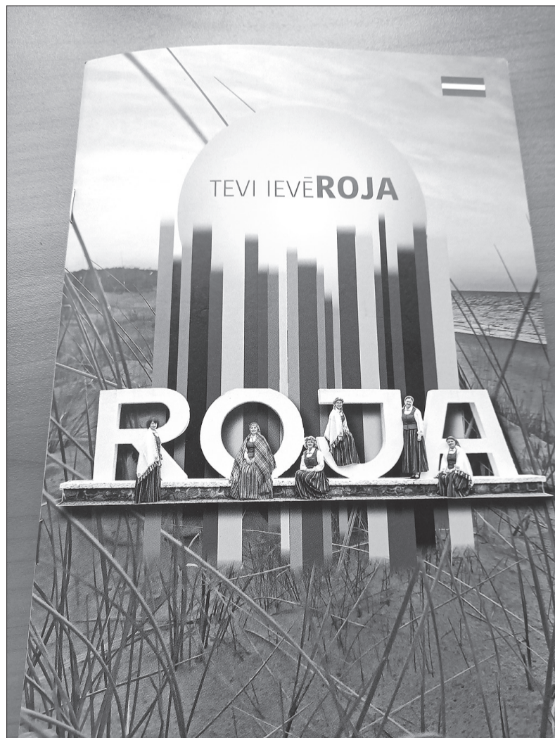
Vāka noformējums tapis, pateicoties māksliniecei Daigai Brinkmanei.

Paldies Gundegai Balodei par ieteikumiem, padomiem un vēsturiskās bukleta informācijas veidošanu! Paldies Mārim Grosbaham par atsaucību