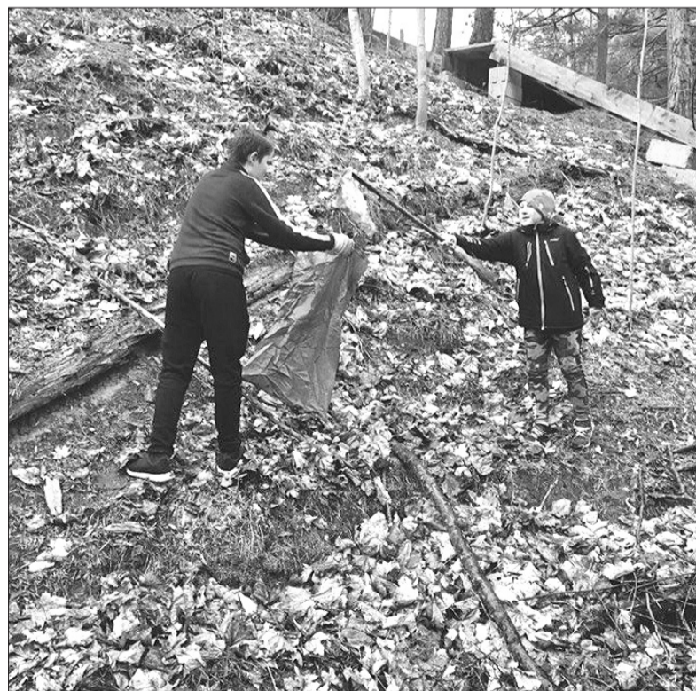
Viena no āra aktivitātēm – apkārtnes sakopšana.

Neskatoties uz esošo situāciju, gaidīsim jūs arī turpmāk uz centru aktivitātēm.