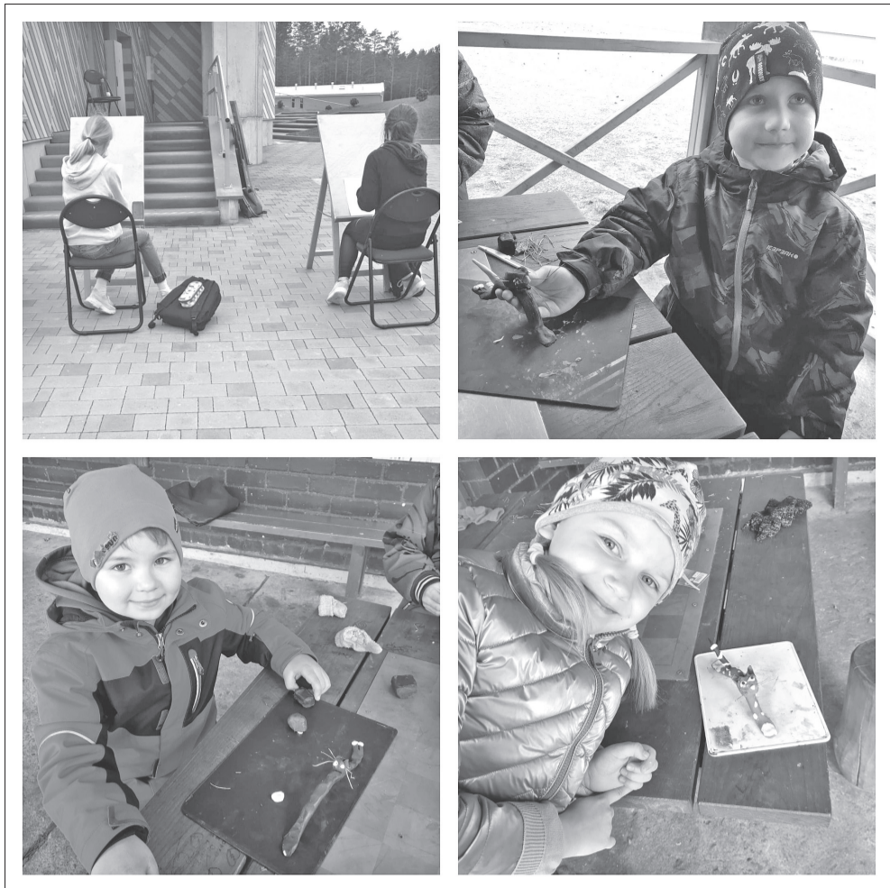
Mazie skolas audzēkņi ar prieku izmanto iespēju pavadīt nodarbības ārtelpās. Albuma foto

Aprīlis pietuvojies izskaņai, jau pusgadu mācības tiek aizvadītas attālināti, tomēr tas nenozīmē, ka mūsu ikdienu būtu kļuvusi mazāk aktīva. Joprojām mūsu pedagogi meklē iespējas piedalīties dažādos konkursos, izmantojam katru iespēju, lai dažādotu mācību procesu, veicam darbus, kas citkārt mācību gadu laikā nenotiek, un cenšamies iepriecināt savējos ar kādiem īpašiem sveicieniem.