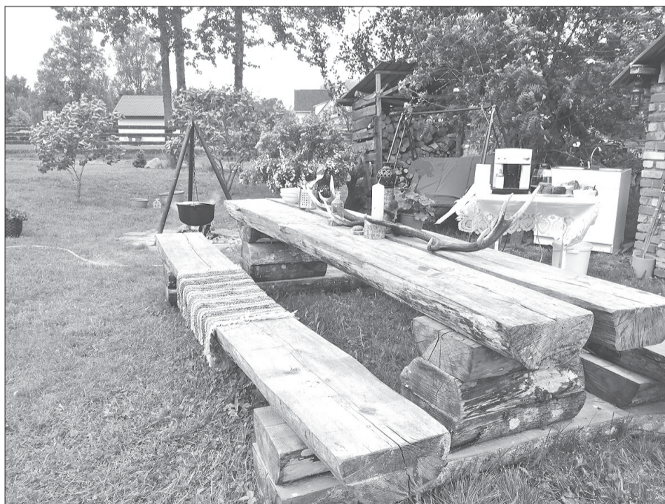
Rojas novada „Joki” allaž izcēlušies ar savu viesmīlību. Lielais zupas katls uz uguns liecina, ka pēc brīža pie šī galda sēdīsies izsalkuši ceļotāji.

Pasākuma mārketinga aktivitātes, vienošanās ar PVD un VID, kā arī kopīgu MKD dalībnieku apmācību organizēšanu, veiks „Lauku ceļotājs” un LIAA. Jau pavasarī drīz „Lauku ceļotājs” uzsāks MKD