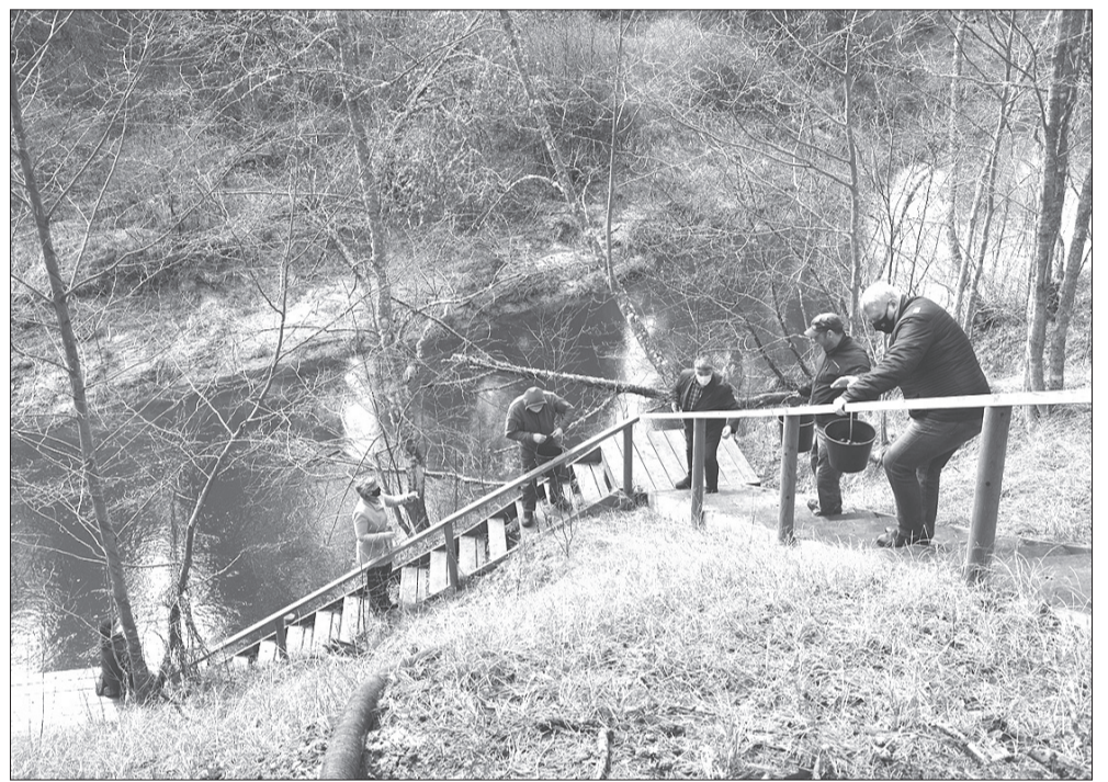
Ievērojot visus piesardzības noteikumus, klātesošie izretinājās visā kāpņu garumā, pa ķēdīti pasniedzot viens otram spaiņus ar zivju mazuļiem.