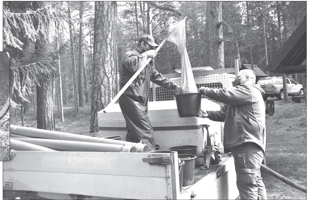
Zivis vispirms tiek izzvejotas no speciāli aprīkoti konteineriem.