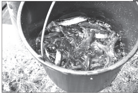
Rojas upē tika ielaisti 5000 šādu dzīvīgu mazuļu.

Ši gada 26. aprīlī Rojas upē tika ielaisti 5000 viengadīgie taimiņu smolti, kas izaudzēti z/i „BIOR” zivju audzētavas „Tome” filiālē „Pelči”. Zivju mazuļi Rojas upē tiek ielaisti Zivju fondā iesniegtā projekta ietvaros, kas turpinās no 2007. gada. Taimiņu mazuļus ieguva no Rojas upē nozvejotiem vaļiniekiem. Taimiņu palaišanā piedalījās pārstāvji no Valsts vides dienesta Ventspils un Liepājas reģionālās pārvaldes, pārstāvji no zinātniskā institūta „BIOR” zivju audzētavas „Tome” filiālēs „Pelči” un pārstāvji no Rojas novada domes.