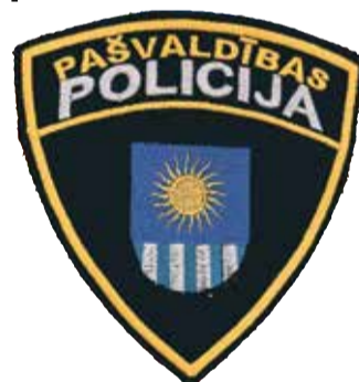
Evita Teice, Saulkrastu pašvaldības policija

Aprīlī Saulkrastu pašvaldības policija saņēmusi 83 izsaukumus. Par dažādiem pārkāpumiem aizturētas 11 personas. 2 aizturētie nodoti Valsts policijas Rīgas reģiona pārvaldes Saulkrastu iecirkņa darbiniekiem turpmākām procesuālām darbībām, 4 nogādāti savā dzīvesvietā, 3 personas – nakts patversmē „Gaiziņš”.