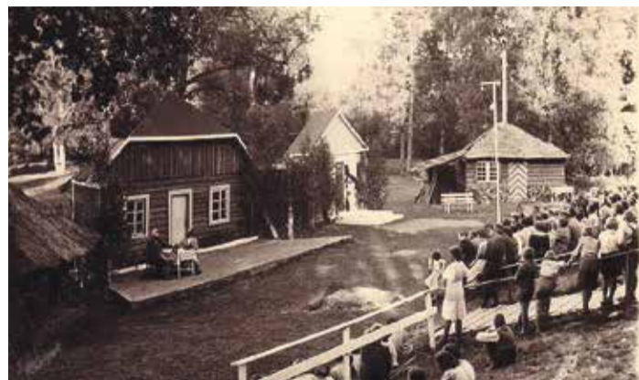
Teātra izrāde Neibādes parkā. 20. gadsimta 30. gadi

Ar gadiem dinamiskas pārvērtības Saulkrastu estrādē notiek populārākās R. Blaumaņa lugas „Skroderdienas Silmačos” iestudējumos. Ja 30. gadu fotoattēlā līgotāji ir gērbušies tautastērpos, tad 2007. gada vasarā Liepājas teātra viesizrādē Kārlēns pa skatuvi spriņģo padīlušos džinsos.