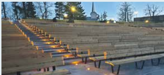
Pašvaldības aktuālie projekti