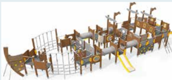
Saulkrastos top jauni rotaļu un aktīvās atpūtas laukumi 3. lpp.