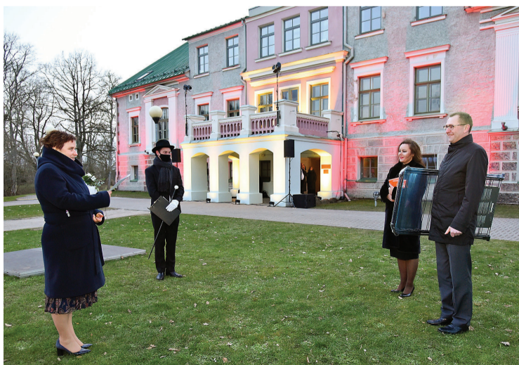
Apbalvojumu saņem SIA „Brabantia Latvia”

Tāpat „Katlaucos” nav sveša mājražošana: te top pieprasīti gaļas produkti, kas tālāk tiek realizēti tirdzniecībā.