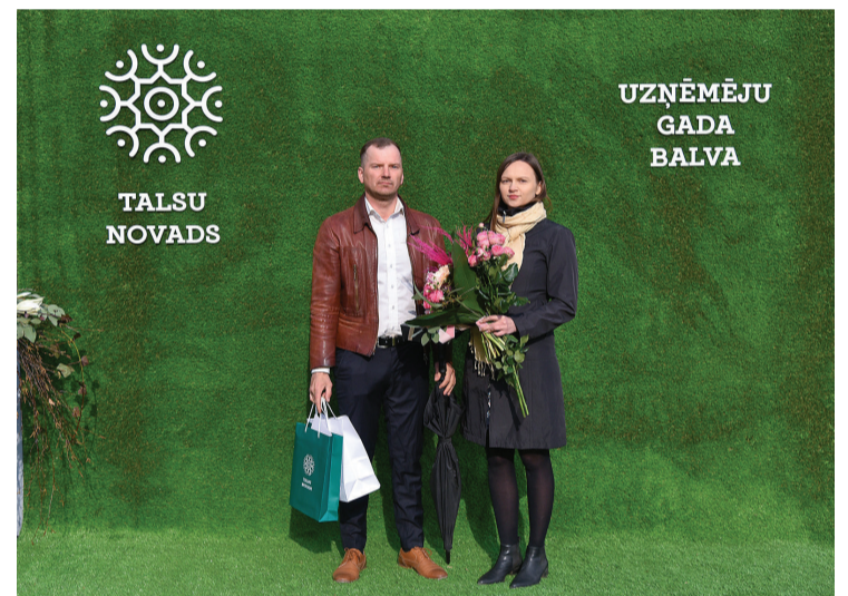
SIA „Nr. 33 Nams” īpašnieki

SIA „Brabantia Latvia” (mātes uzņēmums Nīderlandē) ir metālapstrādes uzņēmums ar 12 gadu stāžu Latvijā. Uzņēmums, kur nodarbināti ap 140 cilvēku, Latvijā ražo gludināmos dēļus un veļas žāvētājus, tos eksportējot uz vairāk nekā 95 valstīm visā pasaulē. Zīmols pasaulē slavens ar atslēgas