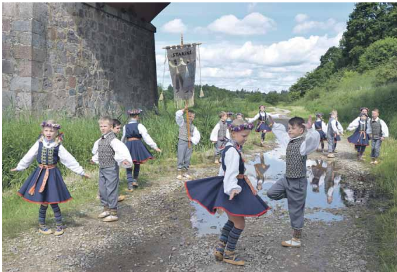
Kuldīgas deju ansambļa sveiciens filmēšanai izvēlēta gan Ventas rumba, gan ķieģeļu tilts, jo tās ir vietas, kas simbolizē pilsētu.

Ar tādu moto Kuldīgas Tautas deju ansambļa Venta studija un bērnu deju kolektīvs Stariņš sanāca pie Ventas, kur tika filmēts video šīgada atšķirīgajiem Skolu jaunatnes dziesmu un deju svētkiem.