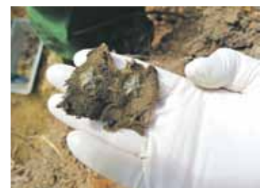
Otrā pasaules kara kauju vietas slēpj baiss liecības. Apskates objektu sarakstā tiks iekļautas tikai nozīmīgākās.

Padomju armija lielgabalus uzspīdzinājusi.