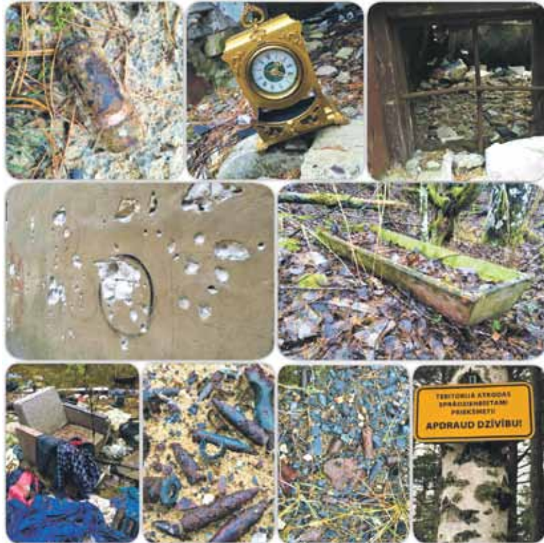
Kari un okupācijas Latvijā atstājušas neskaitāmus militāros objektus un diemžēl arī piesārņotas vietas.

Ja atgriezīamies pie mūspuses, tad sarakstā ir, piemēram, pieminekļi O.Kalpaka bataljona karavīriem Aizpores kapos, Skrundas kaujas piemiņas vieta, Rudbāržu pils, Lēnu baznīca, Lēnu pieminekļi un pārceļšanās vieta, Skrundas skola, Jaunāmuiža,