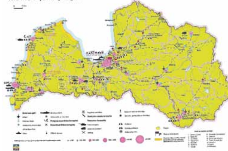
Karte, kurā atzīmētas Padomju armijas atrašanās vietas Latvijā. Katra uzskatāma par mantojumu. Daudzas vēl sarakstā nav iekļautas, bet izpēte turpinās.

1939. gadā, sākot PSRS militāro bāžu celtniecību. Šajā baterijā ietilpa četras B-13 tipa lielgabalu pozīcijas. Pirmā kauja notika