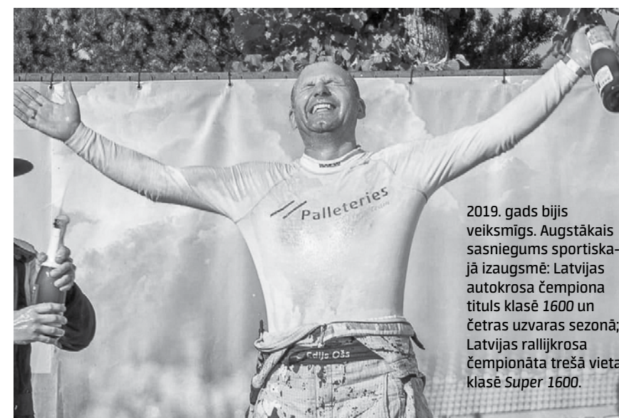
2019. gads bijis veiksmīgs. Augstākais sasniegums sportiskajā izaugsmē: Latvijas autokrosa čempiona tituls klasē 1600 un četras uzvaras sezonā; Latvijas rallijkrosa čempionāta trešā vieta klasē Super 1600.

Izveidojusies laba sadarbība ar Kuldīgas novada pašvaldību. Tā nav slavas