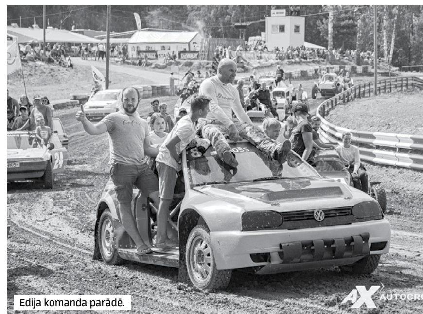
Edija komanda parādē.

tas bijis pozitīvs. Esot visos pasaules tirgos, spējam noorientēties: kur tirgus apstājas, tur saprotam – ir slimības uzliesmojums – un uzreiz pārmetamies uz citu. Ja viens aizveras, cits atveras. Veiksmīgi visiem izskraidījām līdzī, tāpēc darbs bija nepārtraukti. Pat par daudz – pasūtījumu ļoti daudz. Tagad pandēmija mazinās, un Eiropas un Amerikas tirgus ir atplaucis. Šis izaugsmes dod vēl lielākas iespējas.