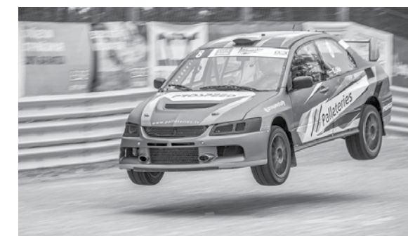
Edija Oša auto sacensību brīdī.