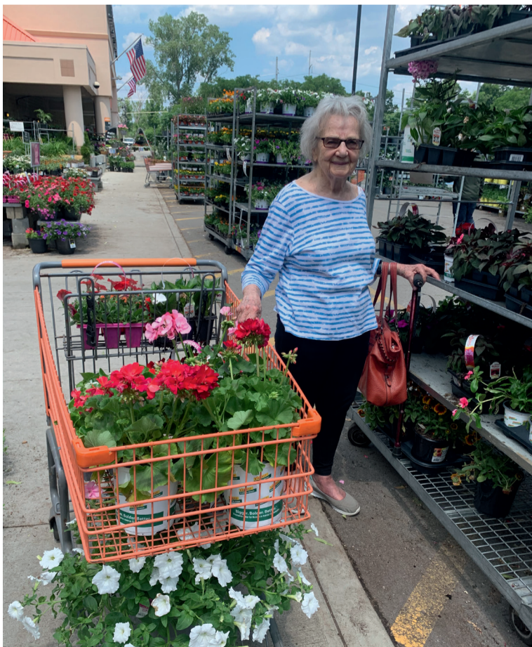
Gaviliece pošas simtgadei