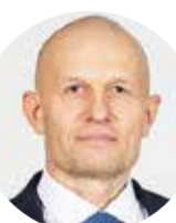
Zigmārs Zeimulis "Latvijas Zaļā partija"