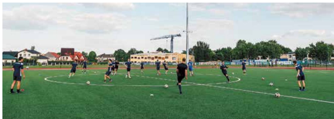
Jauno laukumu atklāšanas vakarā “iesildīja” futbola kluba “Salaspils” sportisti.

dot augsta līmeņa FIFA prasībām atbilstošu stadionu. Federācija no saviem līdzekļiem apņēmas piešķirt Salaspilij pilnīgi jaunu modernu mākslīgo segumu, savukārt Salaspils novada pašvaldība – divus turpmākos gadus atvēlēt vis-