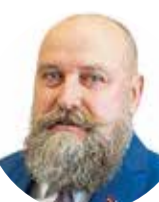
Ernests Moisejs Partija "Nacionālā apvienība "Visu Latvijai!"-Tēvzemei un Brīvībai/LNNK", Politiskā partija "Latvijas Reģionu Apvienība", "LATVIJAS ZEMNIEKU SAVIENĪBA""