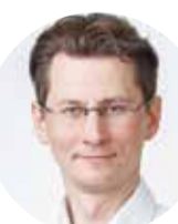
Miks Balodis Partija "Nacionālā apvienība "Visu Latvijai!"-Tēvzemei un Brīvībai/LNNK", Politiskā partija "Latvijas Reģionu Apvienība", "LATVIJAS ZEMNIEKU SAVIENĪBA""