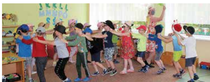
Kas gan ir īsti svētki bez jautrām rotaļām?

Svētku nedēļas ietvaros tika organizēti dažādi pasākumi – grupu sko-