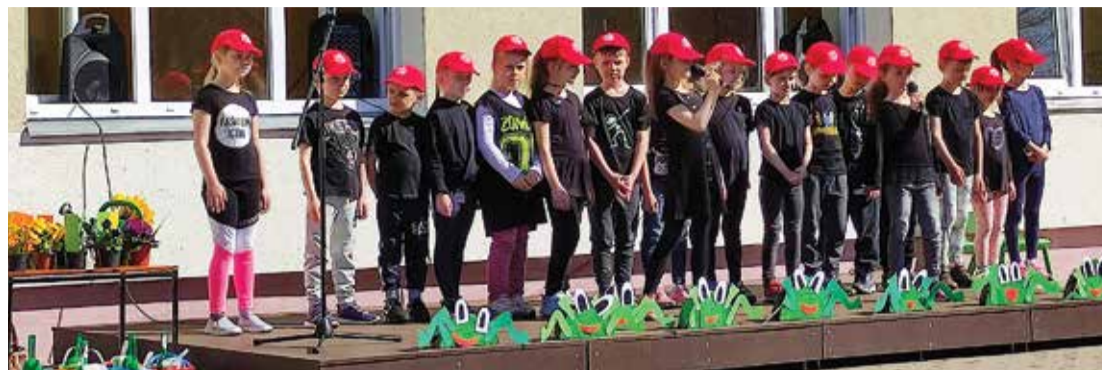
Āra skatuvi steidz iemēģināt PII "Saime" talantīgie bērni.

• "Saimes" bērni aktīvi – ir nosvinēta projekta kulminācijas diena ar dziesmām uz jaunizveidotās āra skatuves un kustību aktivitātēm iestādes teritorijā. Bērniem