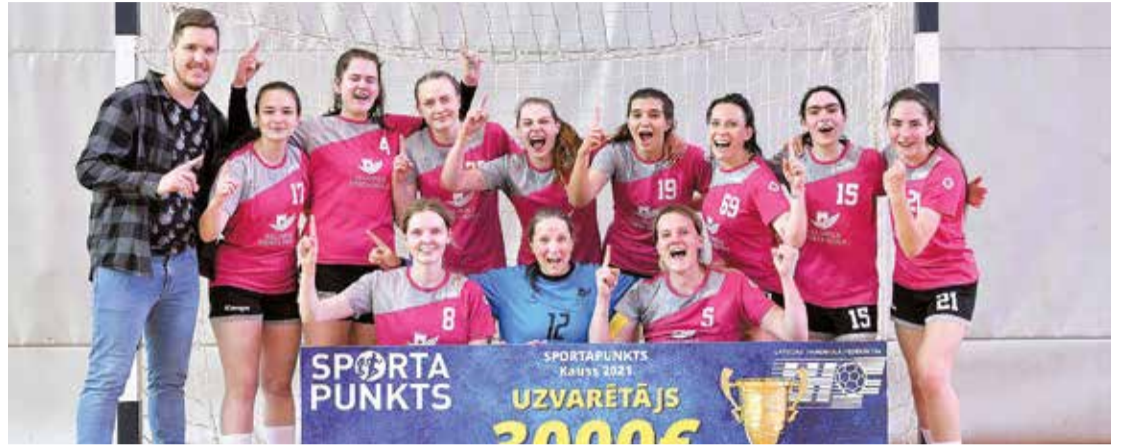
Lieliska uzvara lieliskā spēlē.