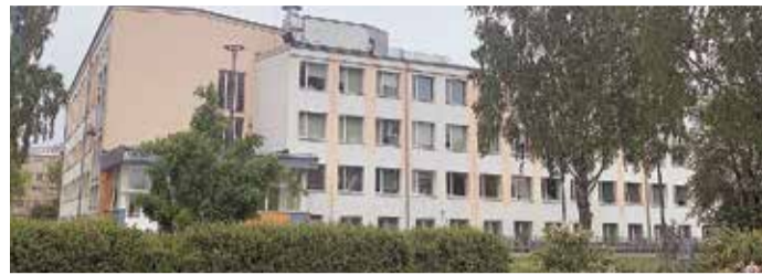
Komisija atzinīgi novērtēja 2. vidusskolas materiāli tehnisko nodrošinājumu.

Salaspils sporta skola iestādes darbības kvalitātes vērtēšanas rezultātiem profesionālās ievirzes izglītības programmas īstenošanā akreditācijas komisijai spēja uzrādīt sasniegto un ieguldīto darbu atdevi, kas rezultējās vairākos augsti novērtētos rādītājos. Atzinīgi tika novērtētas treniņu programmas, kas atbilst izglītības programmām un iestādes vīzijai un izvīzītajiem mērķiem. Notiek regulāras nodarbību vērošanas un mācību procesa analīze, turklāt ikdienas darbā tiek arī izmantota skolvadības sistēma E-klase. Atbilstošs inventārs veicina izglītojamo panākumus. Iestādei ir sadarbība ar Latvijas Basketbola Savienību un labākos izglītojamos iesaista sagatavošanās sacensībās Latvijā. Ļoti labi tika novērtēta arī komunikācija ar audzēkņu vecākiem, izmantojot dažādus rīkus, dalība dažādos sporta pasākumos un pēc audzēkņu vecāku iniciatīvas katru gadu rīkotā Ģimenes diena, kā arī psiholoģiskais atbalsts izglītojamajiem. Kopumā atzinīgi tika novērtēta iestādes darbība, kas veicina dalību sacensībās un iestādes izstrādātā sistēma, lai nodrošinātu izglītojamo sagatavošanos un piedalīšanos sacensībām augstākā pakāpē valsts mērogā. Turklāt notiek arī individuālais darbs ar talantīgajiem audzēkņiem. Tomēr kopā ar pašvaldību