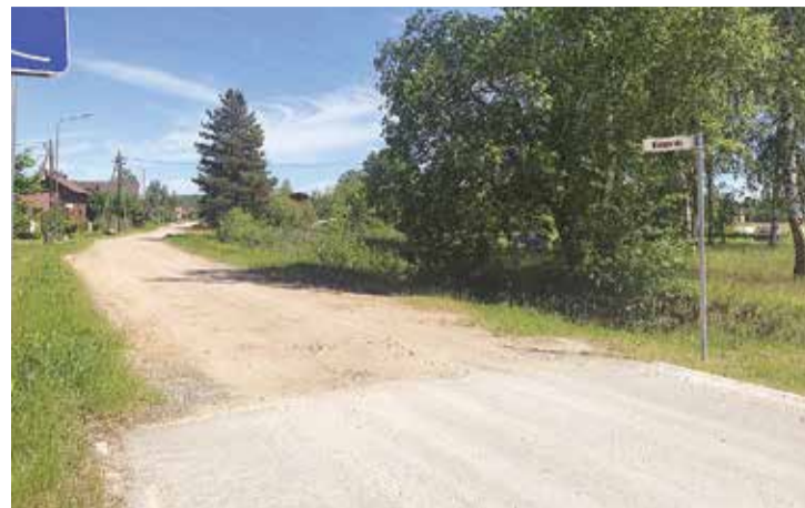
Dubulto virsmas apstrādi veiks arī Biologu ielā.

novērsta ceļu putēšana. Šo problēmu var atrisināt relatīvi lēti, turklāt ceļi nav vairs jāgreiderē. Dubultā virsma neaizstāj asfaltu, bet nodrošina, ka cilvēki vēl desmit Salaspils ielās varēs dzīvot bez putekļiem – baudīt dārzos ienākušās ogas un žaut pagalmā veļu.