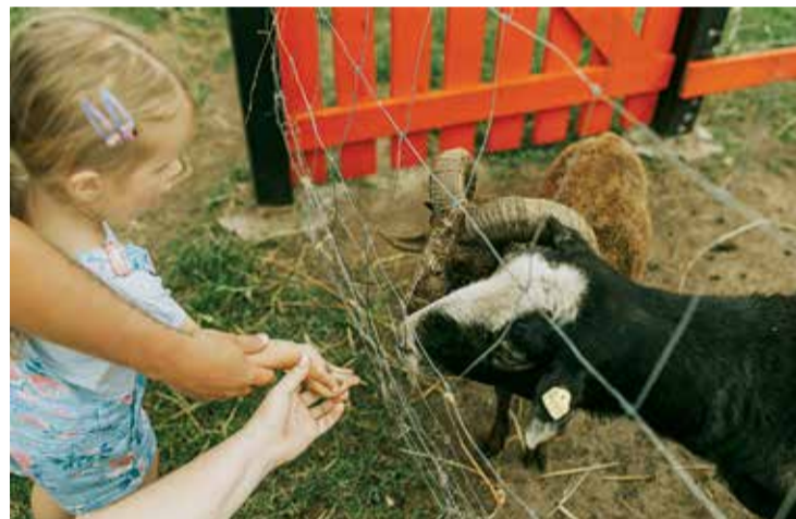
"Rezidence" – lieliska vieta, kur pavadīt brīvdienus.