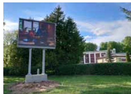
Informāciju sniedza Jēkabpils novada pagastu pārvaldes