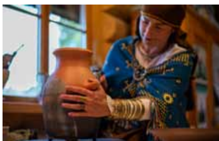
Zemgales plānošanas reģions