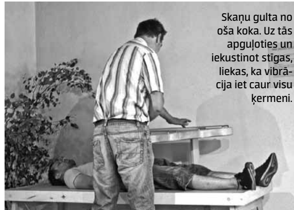
Skaņu gulta no oša koka. Uz tās apguļoties un iekustinot stīgas, liekas, ka vibrācija iet caur visu ķermeni.