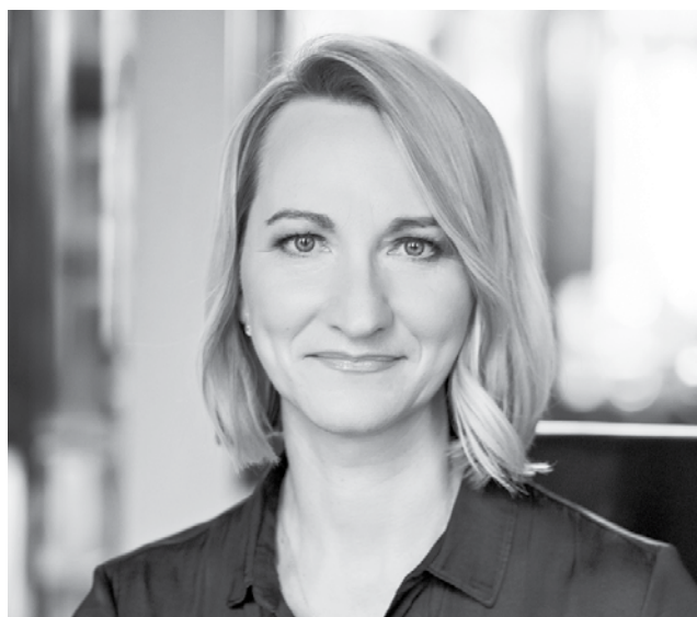
DACE MELBĀRDE, Eiropas Parlamenta deputāte, kultūras un izglītības komitejas priekšsēdētāja vietniece

Pavisam nesen Eiropas Savienībā atklāta digitāla daudzvalodu platforma, kurā ikviens eiropietis, tostarp katrs Latvijas iedzīvotājs, var izteikt viedokli par Eiropas nākotnei būtiskām tēmām, piemēram, veselības aprūpi, nodarbinātību, spēcīgāku ekonomiku un sociālo taisnīgumu visās dalībvalstīs, migrāciju, izglītību un kultūru.