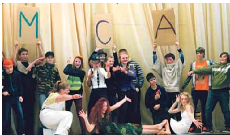
Uzstājas sestā klase.

11. februārī Ulbrokas vidusskolā notika pasākums „Popiela 2014”. Tā bija ļoti neparasta, dažādu fantāziju pilna diena... dejas, mūzikas pavadijums, melodijas, dziesmas, pat dziedātas dziesmas. Septiņas klases piedalījās ar saviem priekšnesumiem. Katrai klasei bija sava deja un dziesma, no kā sanāca interesants priekšnesums.