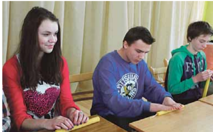
Klašu pārstāvji tin vaska sveces.