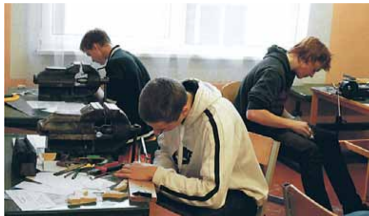
19. februārī mūsu skolā notika ikgadējā Pierīgas reģiona Mājturības un tehnoloģiju olimpiāde.