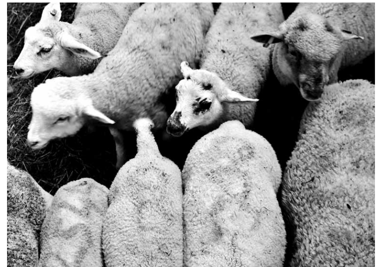
Bez čipa un numura ausīs aitas vēl iezīmē ar īpašu krāsu, kas viegli nenomazgājas, bet dzīvniekam un vilnai nav kaitīga.

tas turam: jaunbūve, kas ir septiņus gadus veca, un vecā ēka, kas vajadzībām pielāgota. Jaunā ēka specializēta tā, lai tajā var ieviest Lego principu – jebkuru aizgaldu un nožogojumu var pielāgot pēc vajadzības un daudzuma. Aizgaldu skaits ir mainīgs atkarībā no grupas lieluma. Tajās var būt no desmit līdz 500 dzīvniekiem atkarībā no fizioloģiskā stāvokļa un citiem faktoriem. Vienīgais limitējošais faktors ir ūdens. Šeit ir recirkulārā sistēma: ziemā ūdens temperatūru nodrošina zemes siltums, bet vasarā tas dod pretējo efektu. Septiņus gadus nav bijusi vajadzība ziemas laikā ūdeni sildīt.