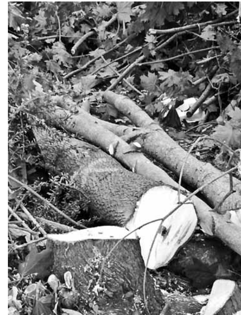
Viens no pagalma pusē nozāģētajiem kokiem.