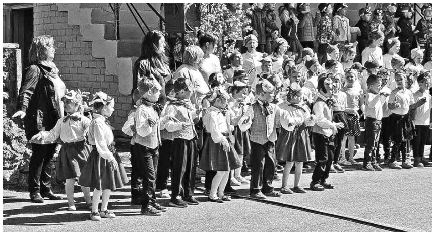
2019. gada maijā Kuldīgas svētkos leskandinām vasaru Pilsētas estrādē uzstājas pirmsskolas bērni.