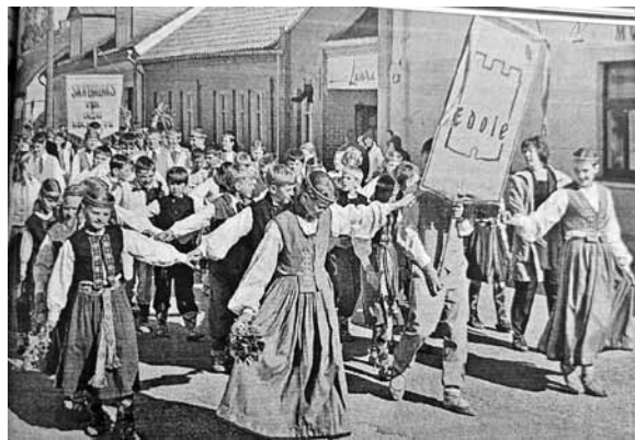
Latvijas mēroga festivāla Sanāciet, sadziediet, sasadancojiet dalībnieki 2001. gadā Kuldīgā dodas gājienā uz estrādi.

Pirms 20 gadiem Kuldīgu pirmo reizi piedziedāja un piedejoja jaunieši no visas Latvijas festivālā Sanāciet, sadziediet, sasadancojiet . To organizēja Izglītības un zinātnes ministrijas Jaunatnes iniciatīvu centrs un Kuldīgas bērnu un jauniešu centrs (BJC).