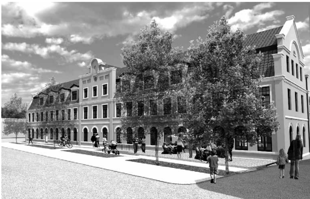
Kuldīgas vecās slimnīcas pārbūves vizualizācija. Būvprojekta autori: uzņēmumi Gints un kolēģi un Arhitektes Lienas Griezītes studija.