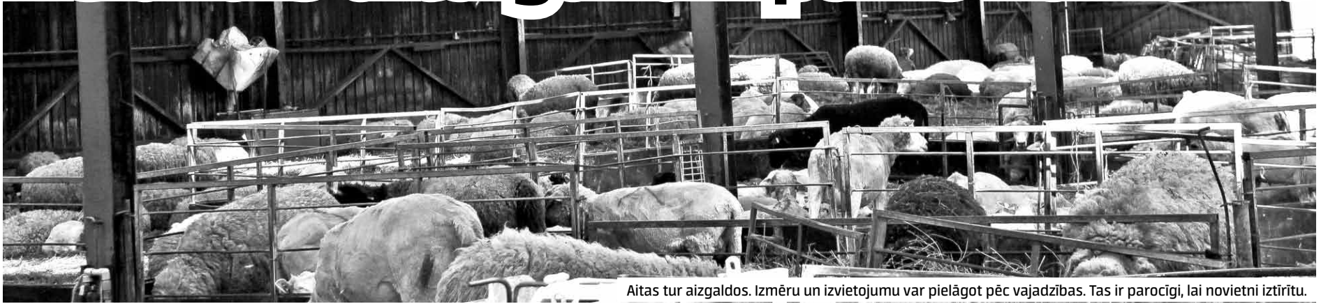
Aitas tur aizgaldos. Izmēru un izvietojumu var pielāgot pēc vajadzības. Tas ir parocīgi, lai novietni iztīrītu.

Latvijas piektā un Kurzemes lielākā aitu audzētava – šādi var raksturot Ēdoles pagasta Mežokus, kur vienmēr ir ap tūkstoš aitām.