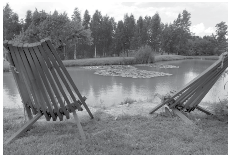
Lieliska atpūtas vieta. Diķi aug ūdensrozes, ūdens attīrīšanai ielaisti amūri, kas ir labākie melioratori, jo barību spēj atrast paši un ēd visus ūdensaugus.

• Īrisu ziediem ir daudzveidīgas nokrāsas – kā nevieniem citiem. Romieši kādu pilsētu nosaukuši par Florenci (Ziedošo), jo ap to ziedējis ļoti daudz īrisu. Tos godāja arī Senajā Ēģiptē, kur tie audzēti jau 15.–14. gs. p.m.ē. • Īrisi augsti vērtēti ne tikai pēc ziedu, bet arī sakņu aromāta. Sakņu izvilumus lieto parfimērijā, konditorejas izstrādājumos un alkohola ražošanā. • Savvaļā zināmas 250 sugas, kas aug Āzijā, Eiropā, Ziemeļamerikā un Ziemeļāfrikā.