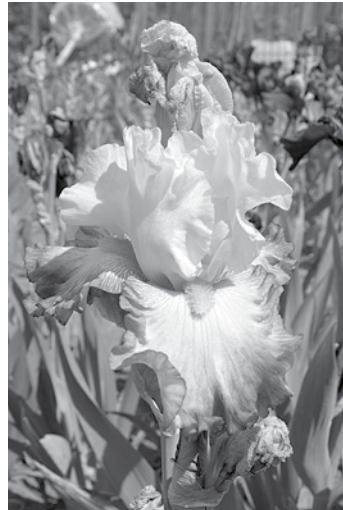
Karstuma dēļ īrisu ziedēšanas laiks bijis krietni īsāks nekā citugad.