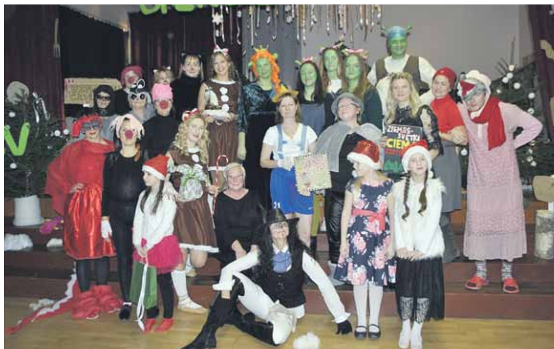
Vienu no Centra vidusskolas tradīcijām ir Ziemassvētku ludziņa, ko skolēni iestudē kopā ar skolotājiem.